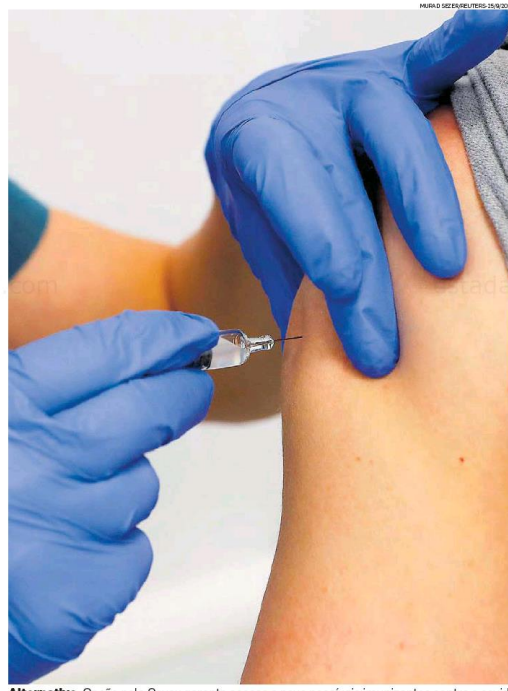
Alternativa. Opção pela Covax garante acesso a nove possíveis imunizantes contra a covid

"Haviam duas opções na adesão, uma com o valor um pouco menor, mas com um risco maior. A que o Brasil aderiu foi a opção dois, em que nós poderíamos escolher a vacina. Isso nos trará uma segurança para a população, uma vez que só será ofertada para a população brasileira aquela que for aprovada pela Anvisa."