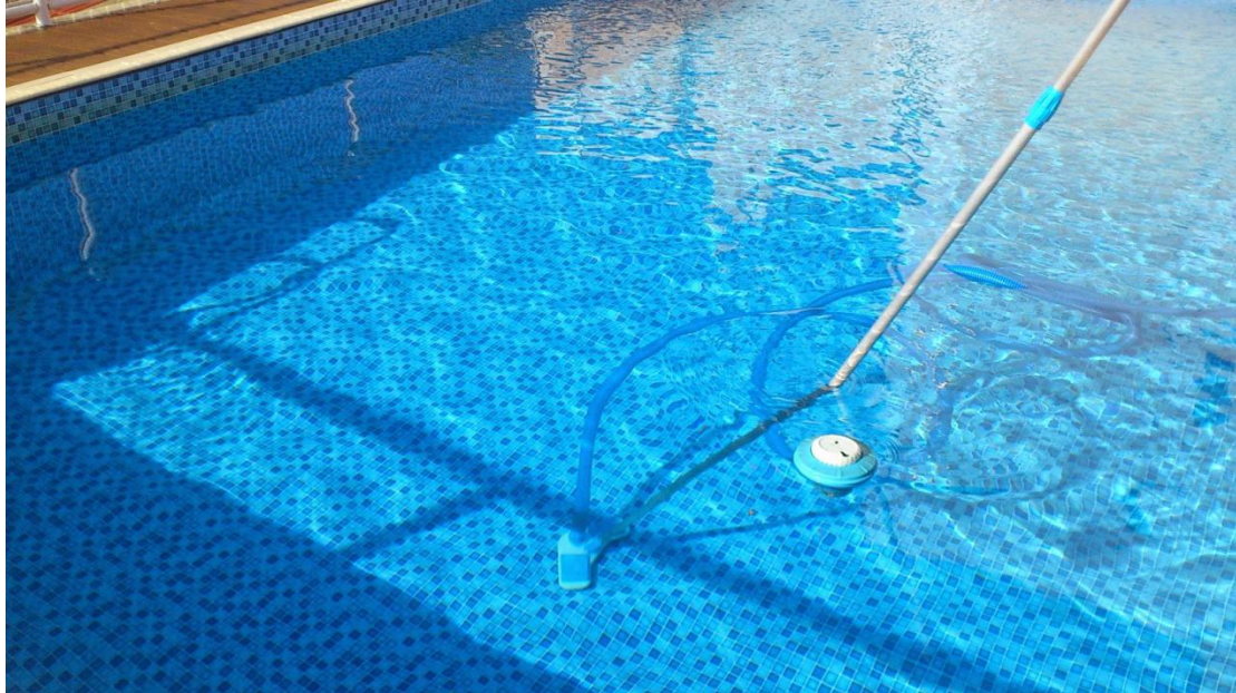
A reposição de água na piscina deve ocorrer após uma semana de uso e limpeza.

O fato de limpar a piscina periodicamente, aliado ao uso pelos banhistas e a evaporação, sugere que haja reposição da água da piscina. No verão, depois de uma semana de uso e após a limpeza semanal das paredes, é necessário acrescentar água para repor o nível.