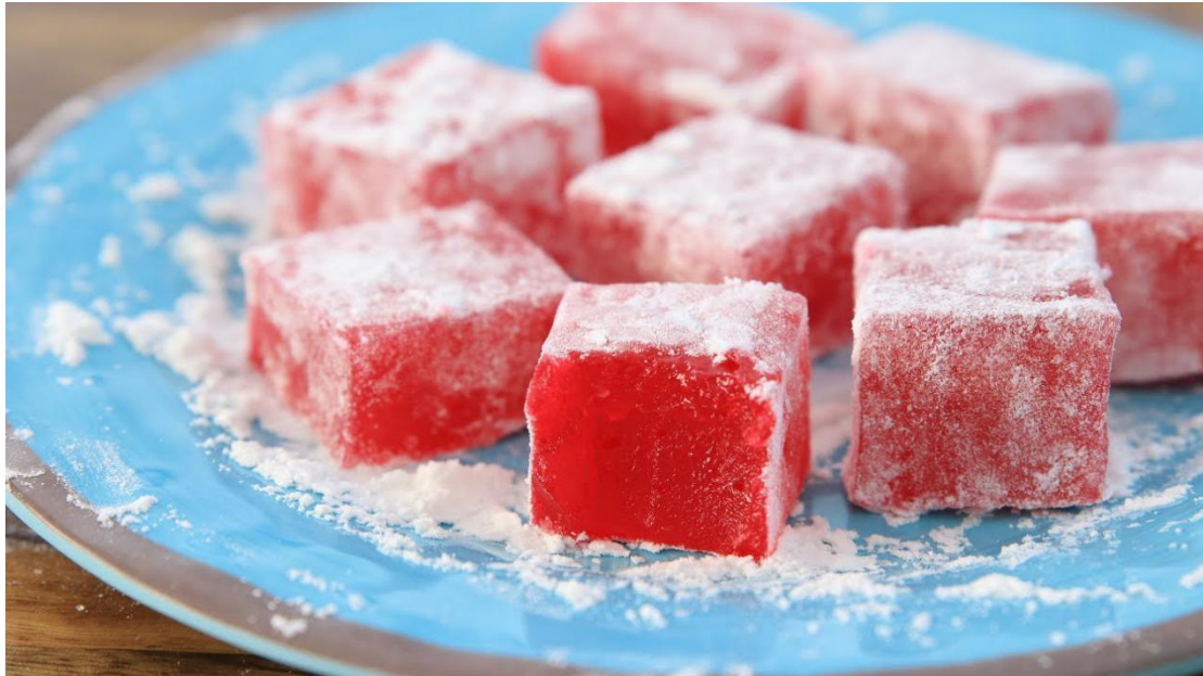
O lokum é uma delícia turca servida durante o Seker Bayrami.