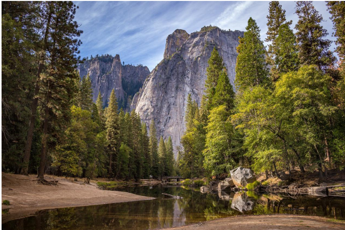
Parque Nacional de Yosemite: uma das belezas encontradas na road trip entre San Francisco e Las Vegas.

Ela também corta a US-395 e passa pelo Death Valley, ou Vale da Morte, um deserto californiano classificado como um dos lugares mais quentes do planeta durante o verão. O deserto conta com paisagens surreais e até mesmo picos altíssimos que estão cobertos pela neve no inverno.