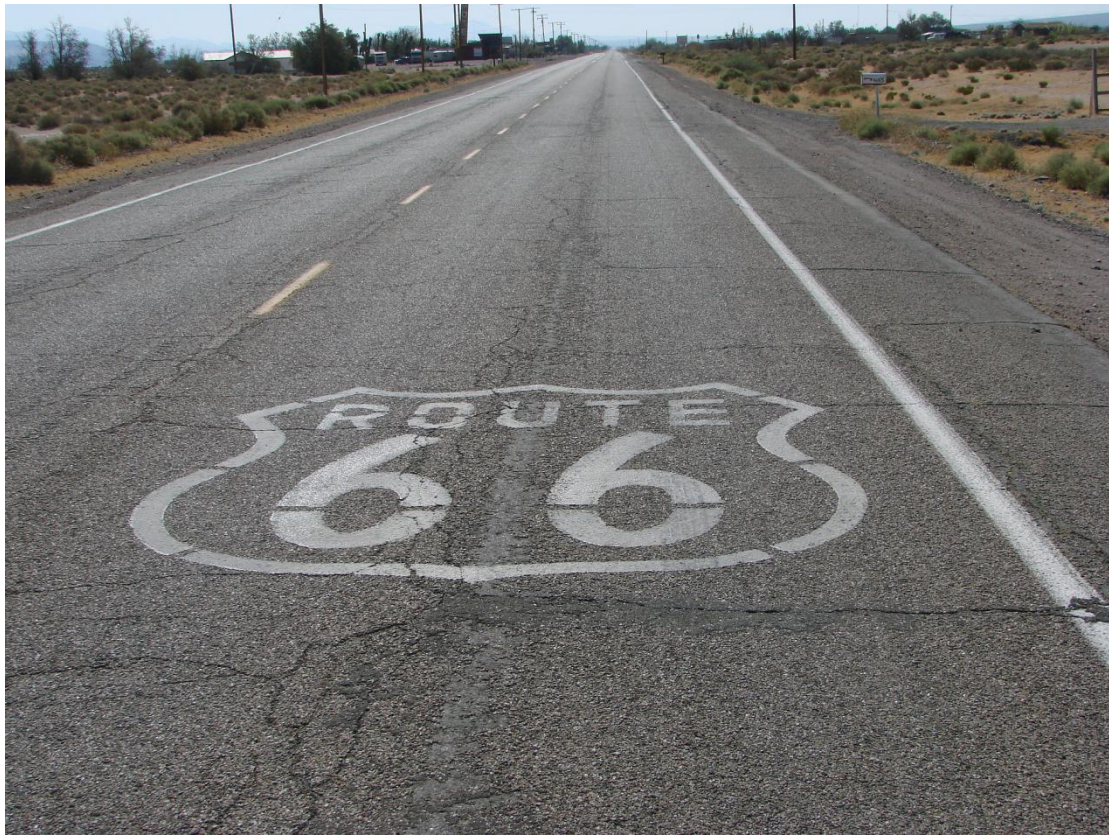
Atravessar a Rota 66 ainda é a road trip mais clássica dos Estados Unidos.

O ponto final original de 1926 estava na 7th Street com a Broadway, em Los Angeles. Atualmente, ele foi transferido para o cruzamento da Lincoln Boulevard com a Olympic Boulevard, em Santa Mônica.