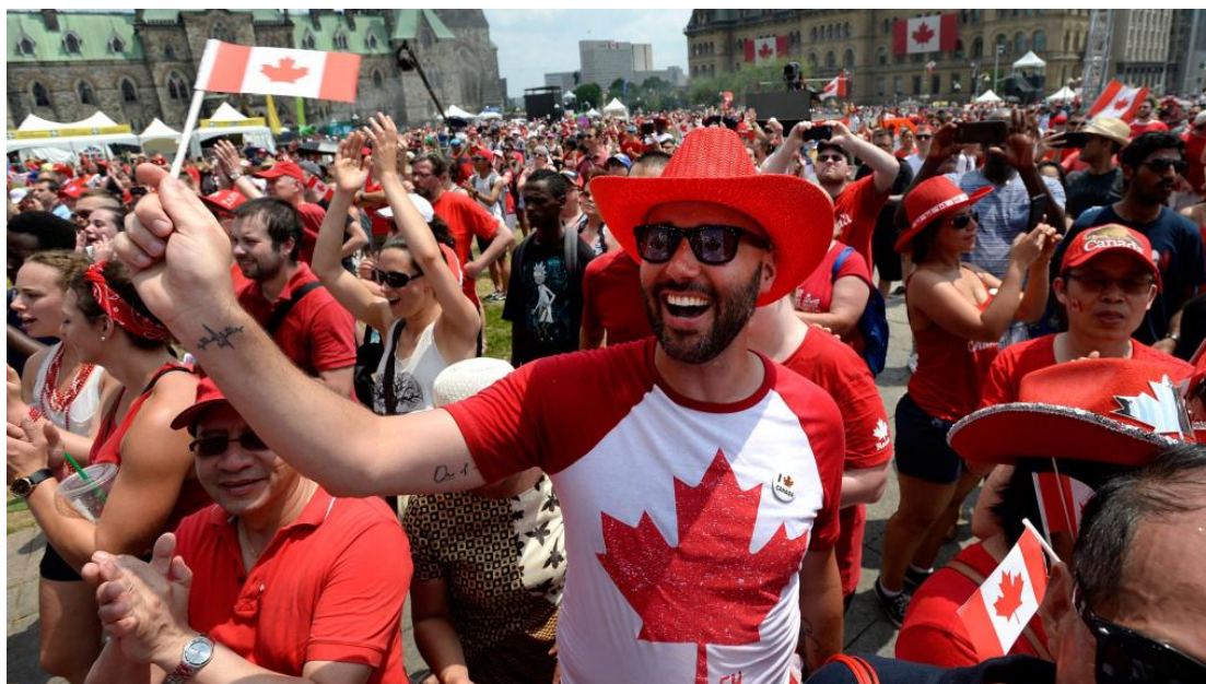
O Canada Day celebra a publicação do Ato Constitucional de 1867.

O feriado nacional do Dia do Canadá é comemorado em 1º de julho e serve para os canadenses celebrarem a publicação do Ato Constitucional de 1867. Algo que talvez possa ser comparado à independência brasileira.