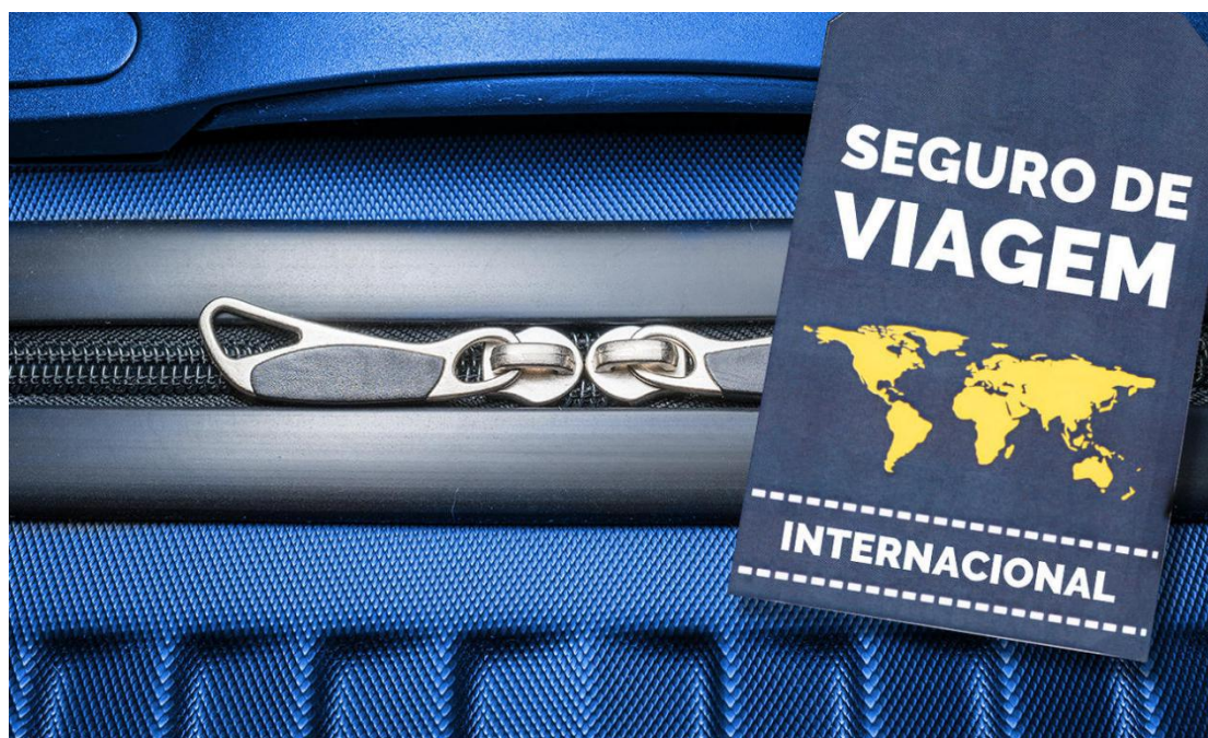
O seguro viagem é obrigatório para entrar nos países pertencentes à União Europeia.

No entanto, há países que oferecem esse documento livre de taxas para que o cidadão se cadastre posteriormente no sistema público local. E é exatamente o que ocorre entre Brasil e Portugal.