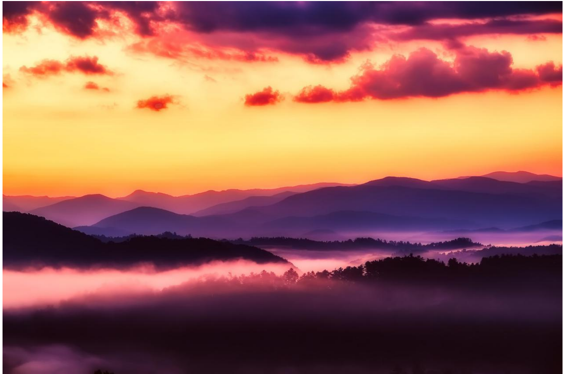
O Great Smoky Mountains National Park é famoso pela presença de uma névoa azulada em sua paisagem.