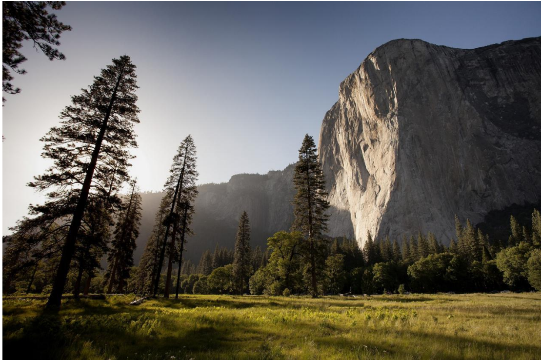
El Capitan, a maior rocha de granito do planeta.