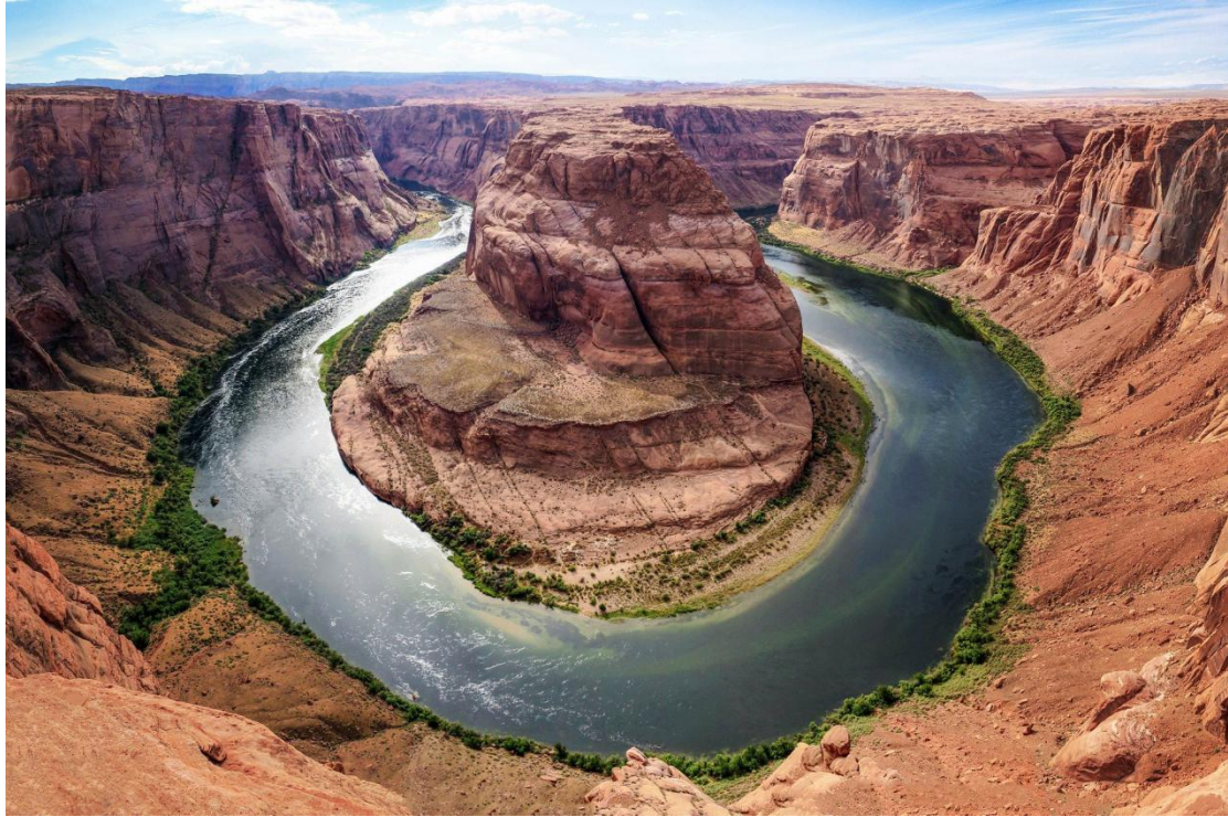
O Grand Canyon é formado por rochas multicoloridas esculpidas em camadas ao longo de 2 bilhões de anos.