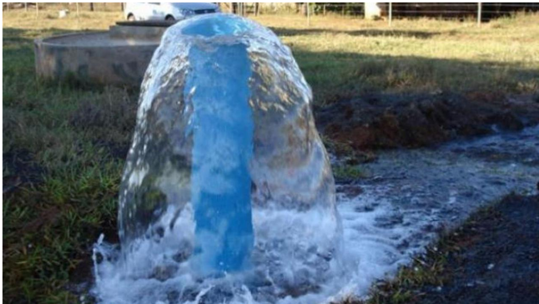
Proprietários de estabelecimentos comerciais e industriais se beneficiam com a presença constante de água.

É importante frisar, mais uma vez, a necessidade de um trabalho profissional para que não haja problemas futuros na captação da água. Regiões que oferecem rochas com baixo potencial de fornecimento podem causar até o secamento da fonte com o passar do tempo.