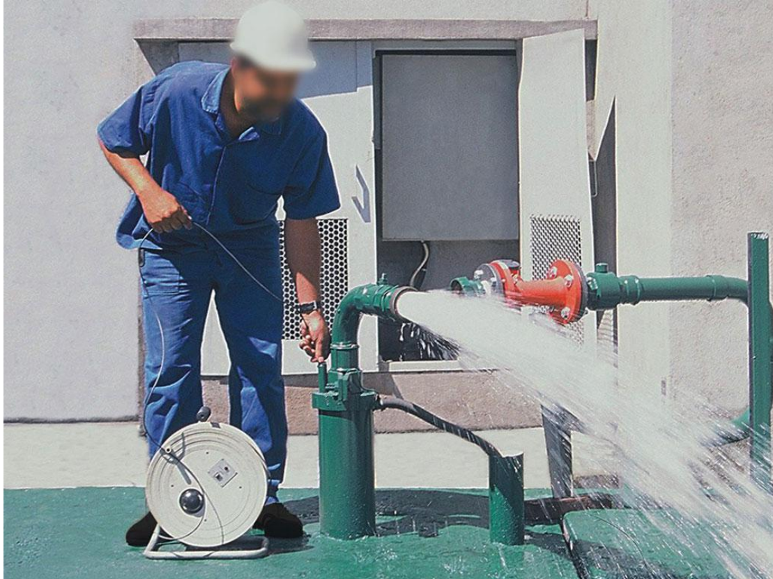
A manutenção preventiva de um poço artesiano pode ser feita uma vez ao ano.

No geral, um poço construído de maneira correta e planejada tende a precisar de menos manutenção se comparado àqueles construídos em solo sedimentar, por exemplo. Nesse caso, ocorre o respeito ao dinheiro investido na tecnologia e a garantia de um projeto duradouro e rentável.