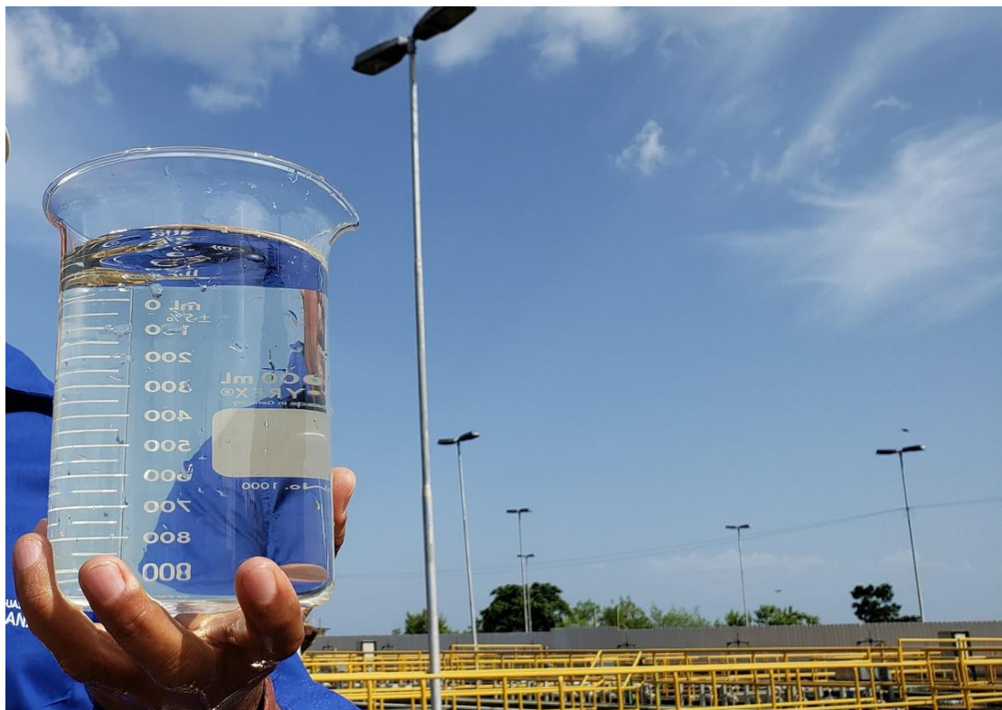
A água extraída de um poço artesiano costuma ser de alta qualidade.

Isso acontece porque a água infiltrada nas rochas e sedimentos sofre um processo de filtração enquanto caminha por ambos. No entanto, é preciso que sejam feitas análises prévias e periódicas para a confirmação da sua pureza. Assim como a limpeza do poço.