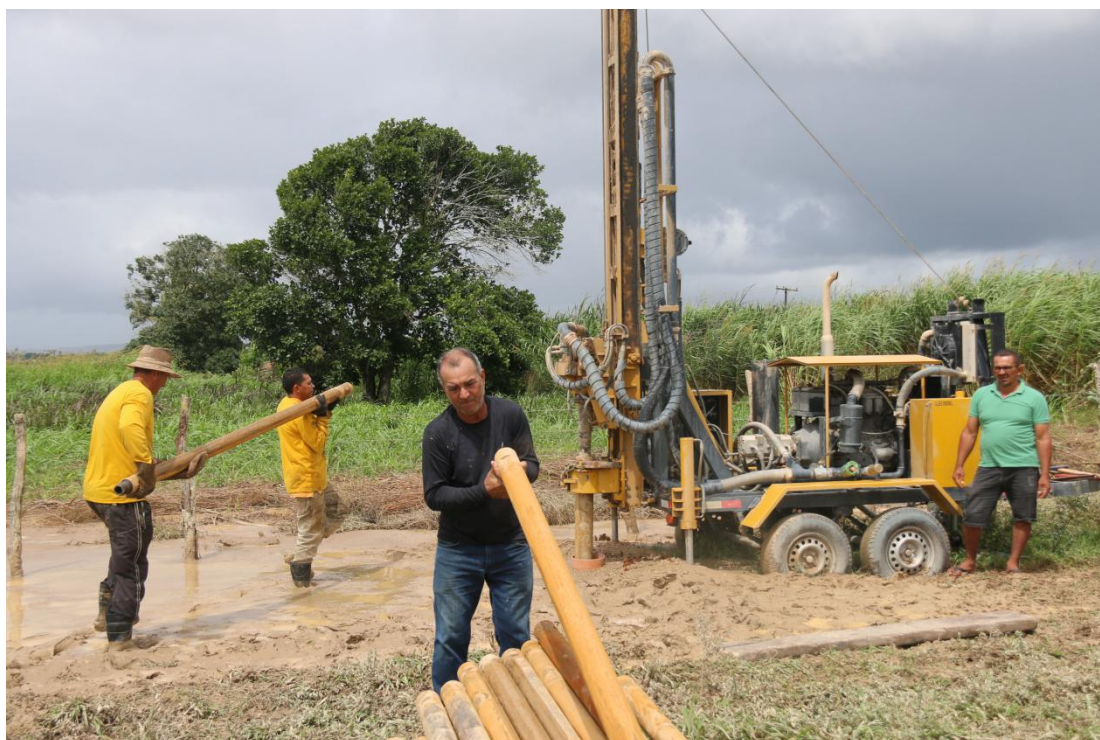
A implantação depende do tipo de subsolo a ser escavado e do equipamento de perfuração.

Além do mais, a Poços Artesianos Já coloca o cliente em contato com vários especialistas e engenheiros que possuem um alto grau de capacidade técnica. Paralelo a isso, busca-se encontrar os melhores preços, sempre em respeito ao bolso do cliente.