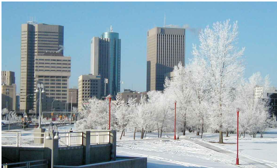
The Forks Historic Site, região turística localizada no centro de Winnipeg coberta pela neve.

O mesmo pode se falar de Victoria. Apesar de nevar, o inverno é menos frio que no resto do Canadá. As temperaturas geralmente variam entre 0°C e 8°C.