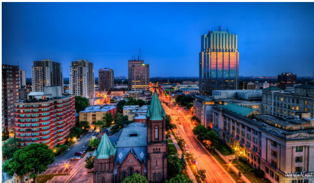
Visão geral da aconchegante cidade de London, no Canadá.

London, no Canadá, oferece grande riqueza arquitetônica em seus edifícios antigos, bem como um ambiente urbano moderno. Seus parques são belos, a taxa de criminalidade local é pequena, as escolas e universidades são excelentes e as alternativas de lazer e cultura contam com grande destaque nacional.