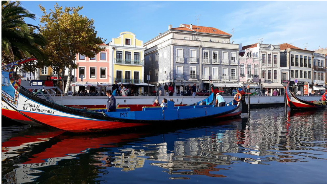
A Veneza Portuguesa também esbanja charme e romantismo, envolta por belíssimos edifícios.