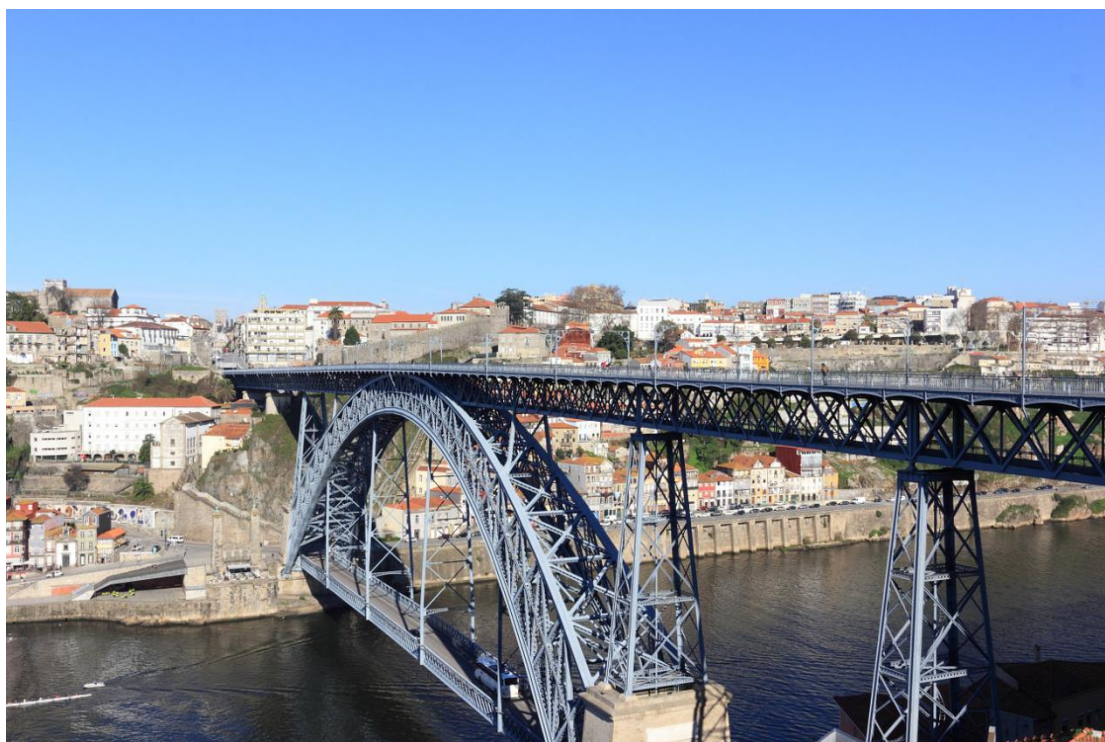
O arco da Ponte Dom Luís ainda é considerado o maior do mundo em ferro forjado.