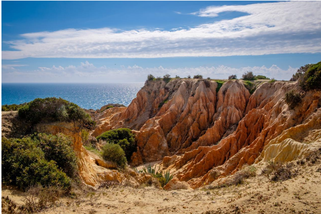
A região do Algarve surge como um dos paraísos naturais de toda a Europa.