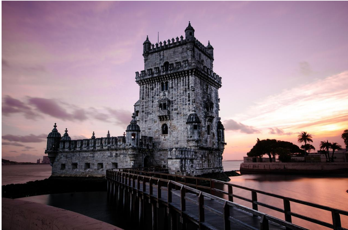
A bela Torre de Belém é uma das principais atrações turísticas de Portugal.