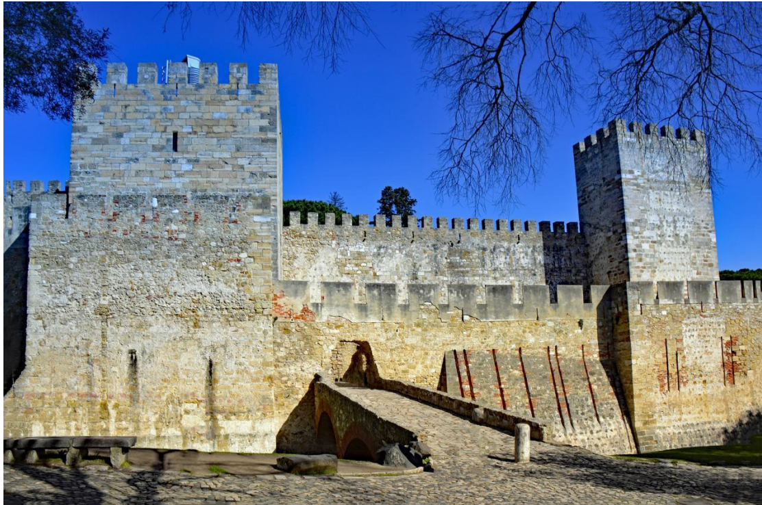
O Castelo de São Jorge abriga uma história de 10 séculos.