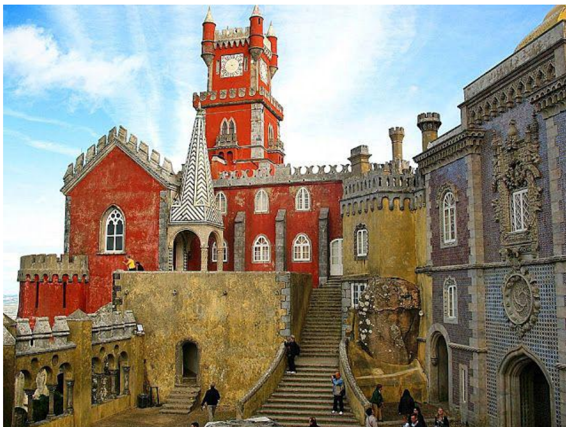
Sintra tem com destaque turístico o Palácio Nacional da Pena.