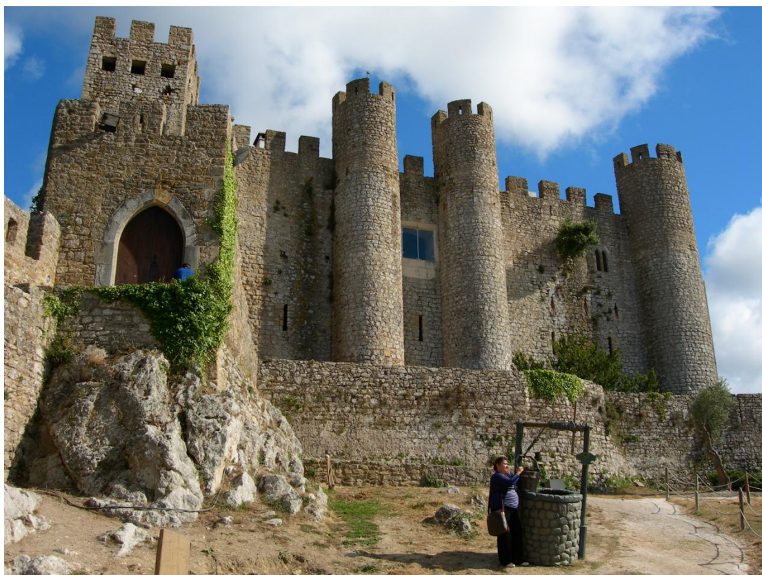
O belo Castelo de Óbidos é uma das Sete Maravilhas de Portugal.

E se você gostou das nossas dicas dos principais pontos turísticos de Portugal, aproveite e compartilhe com a gente seus comentários. Caso tenha outra opção para inserir na lista, não hesite, e ajude esse artigo a ficar ainda mais completo.