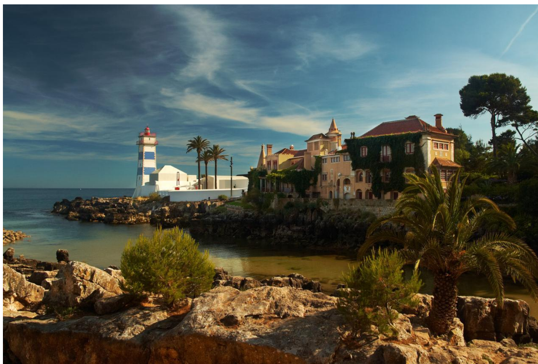
Cascais é uma cidade que respira qualidade de vida e sua baía se destaca na paisagem.