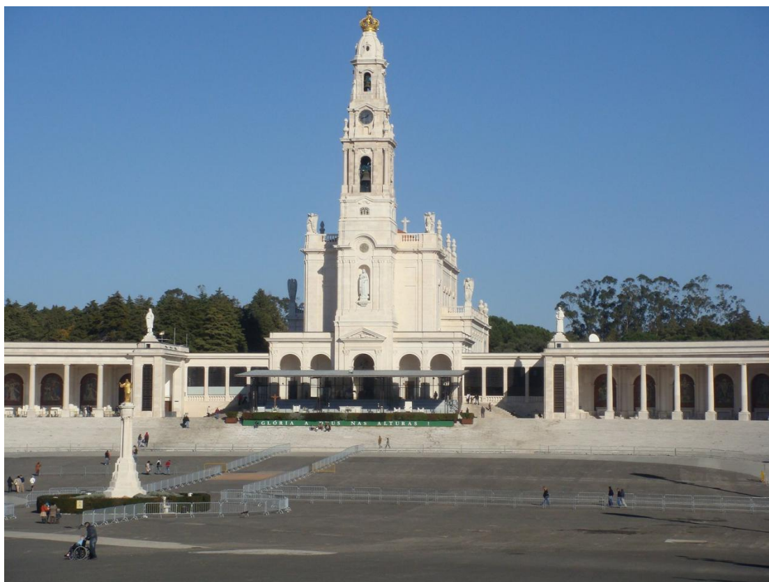
O Santuário de Fátima recebe cerca de 6 milhões de visitantes por ano.