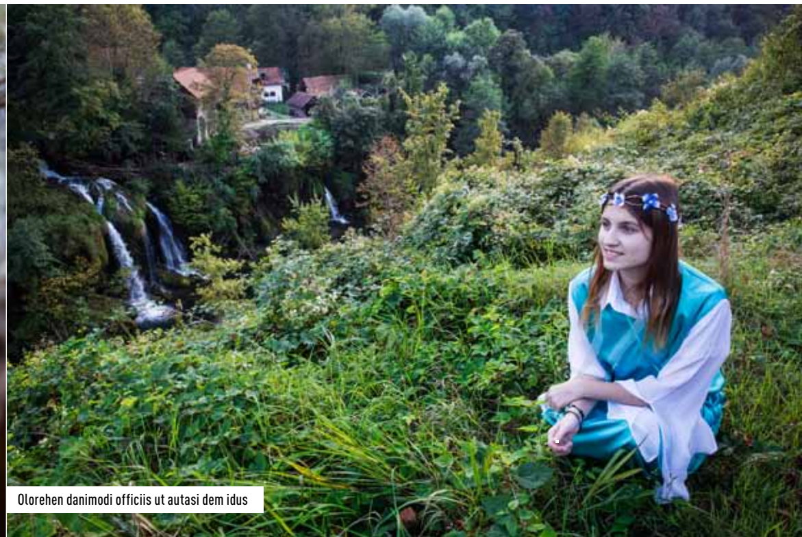
Olorehen danimodi officii ut autasi dem idus

De Kroatische kustlijn is al langer een bekende toeristische bestemming, maar Kroatië heeft veel meer te bieden dan zee en zon. Het midden van het land is bedekt met uitgestrekte bossen. Het toerisme staat hier nog in de kinderschoenen, wat het groene hart van Kroatië tot een avontuurlijke - en toch toegankelijke - bestemming maakt.