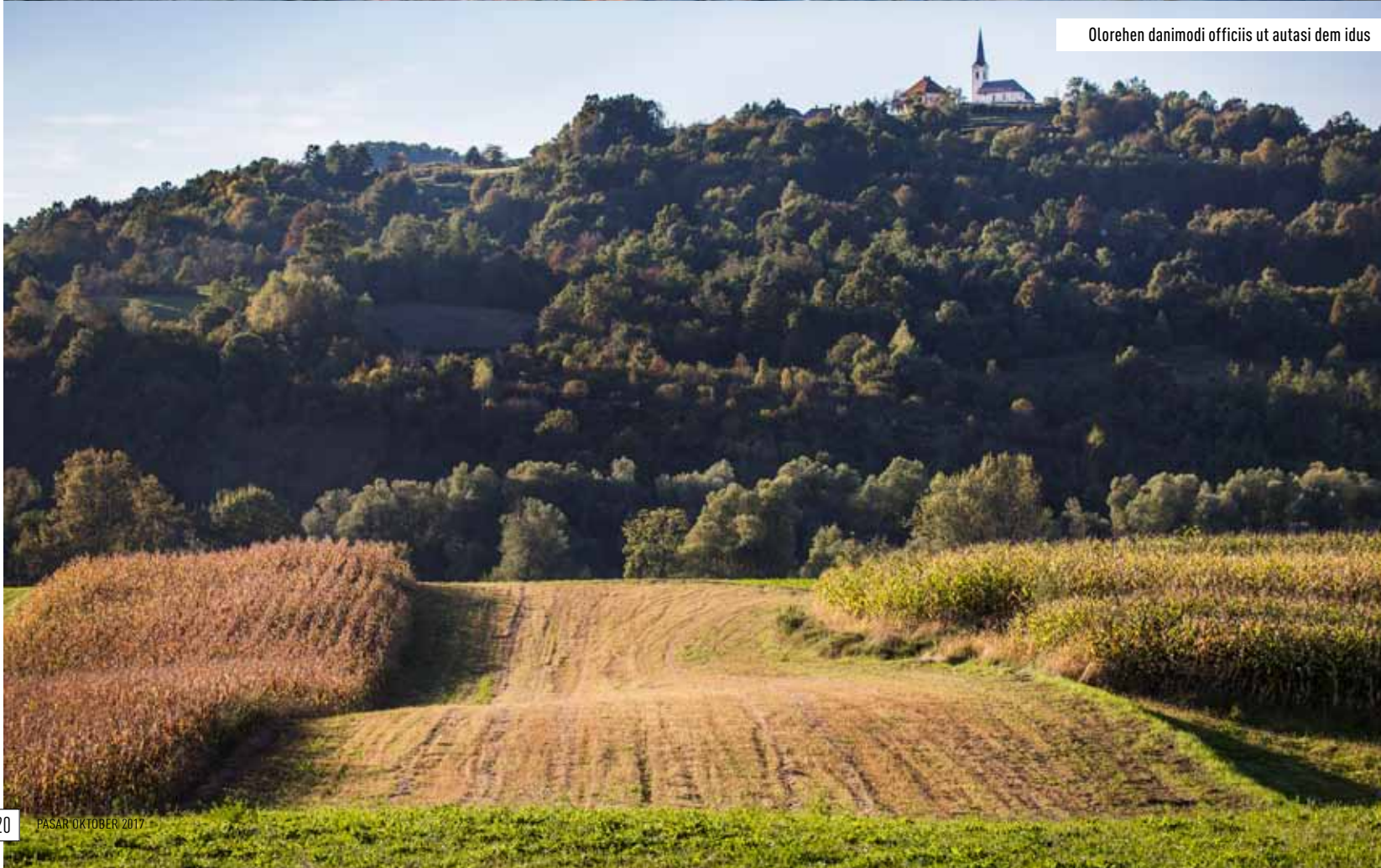
Olorehen danimodi officis ut autasi dem idus