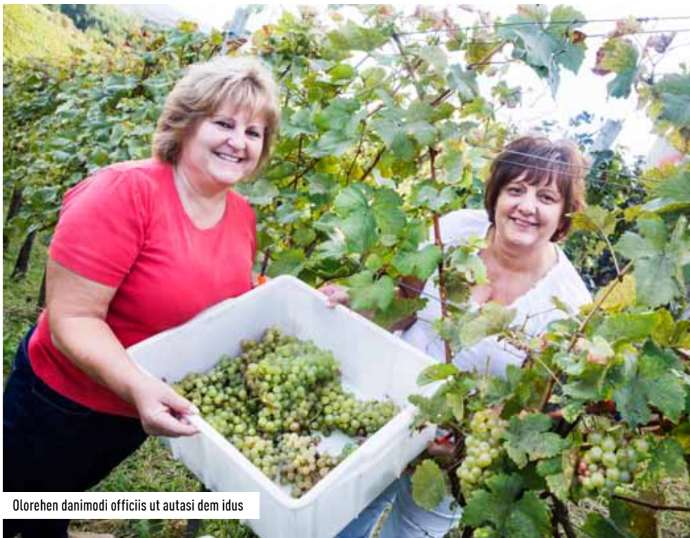
Olorehen danimodi officiis ut autasi dem idus