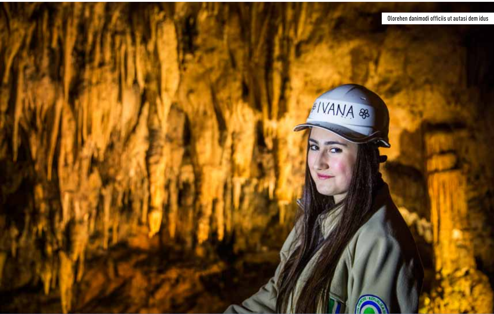
Olorehen danimodi officis ut autasi dem idus