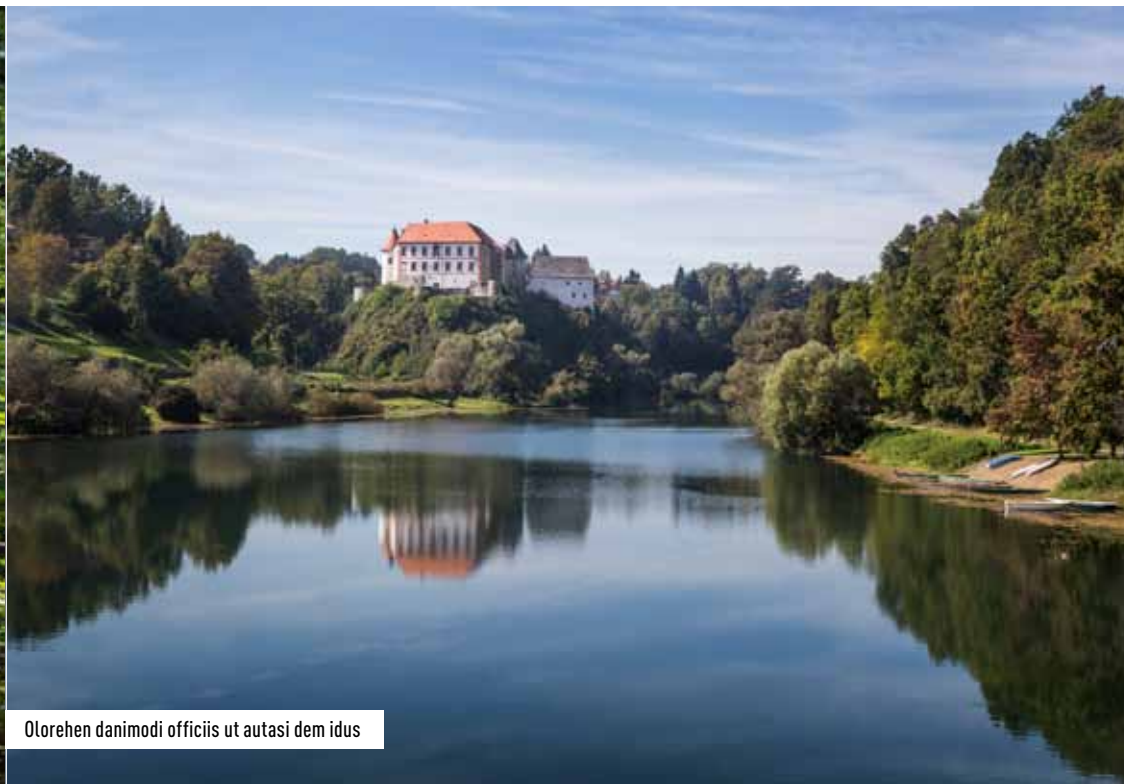
Olorehen danimodi officii ut autasi dem idus