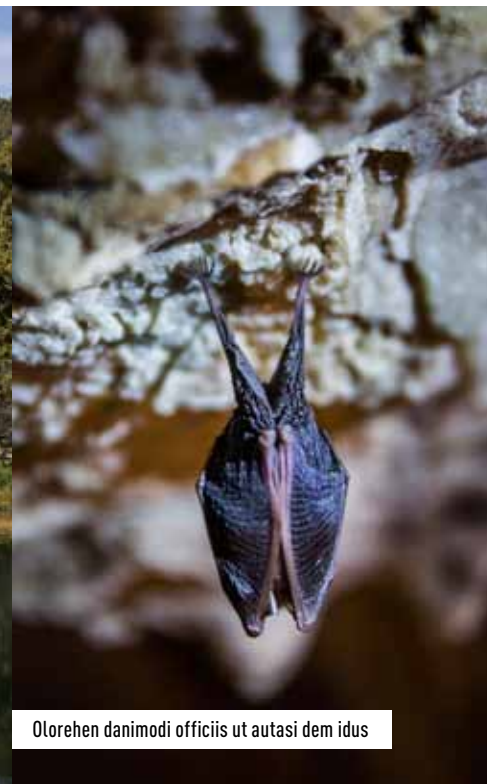
Olorehen danimodi officii ut autasi dem idus