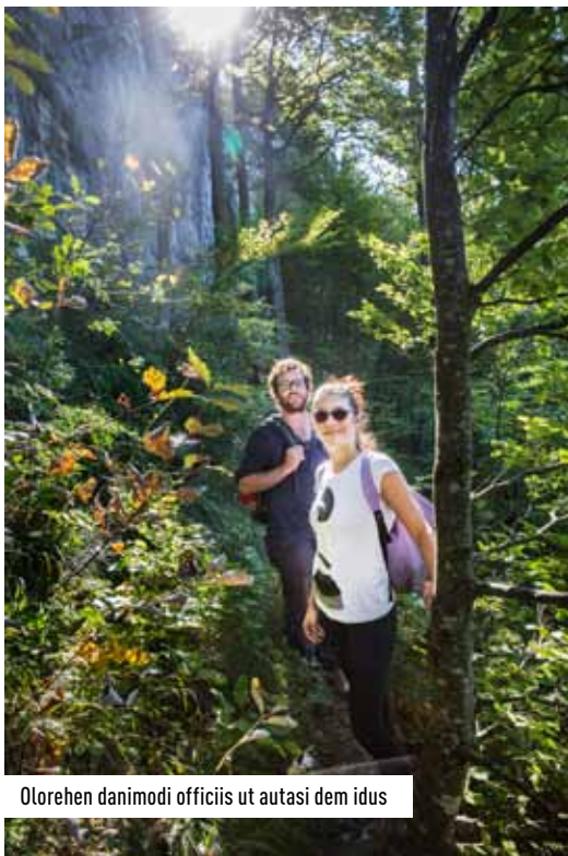
Olorehen danimodi officii ut autasi dem idus