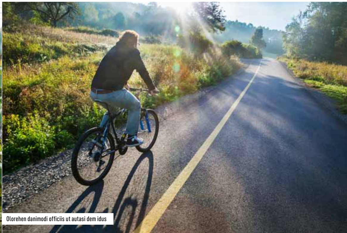
Olorehen danimodi officiis ut autasi dem idus