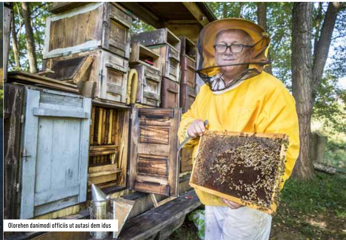
Olorehen danimodi officiis ut autasi dem idus

het groen. Op stormachtige nachten zouden heksen en elfen zich rond de top van de berg verzamelen om de reus opnieuw wakker te maken. Volgens hen is hij alleen maar in een diepe slaap gesukkeld. Vanuit Ogulin kan je tot aan de voet van de Klek stappen. Een rood-witte cirkel duidt het pad naar boven aan. Op de flanken van de berg leven lynxen, beren en wolven. Oude beuken leunen scheefgezakt tegen elkaar aan, vol met spechtgaten. Honderd meter tot de top wandelen we onder een bord waarop met gebarsten letters 'Welkom in het rijk van de Klek-heksen' staat geschilderd. Plots stoppen de bomen en kijken we over een reusachtig groen duinlandschap tot Zagreb. Uit het dal ver onder ons klinken boerderijgeluiden. We staan op het hoofd van de Klek. Verder naar het westen liggen de benen van de reus, de Klecici, met daartussen een beboste heup. We speuren naar beren die zich zitten vol te proppen voor hun winterslaap, maar tevergeefs. Tijdens de zomermaanden kan je na vijf uur in de namiddag beter niet meer de bossen in. Dan dalen de beren af om beneden in de vallei te drinken.