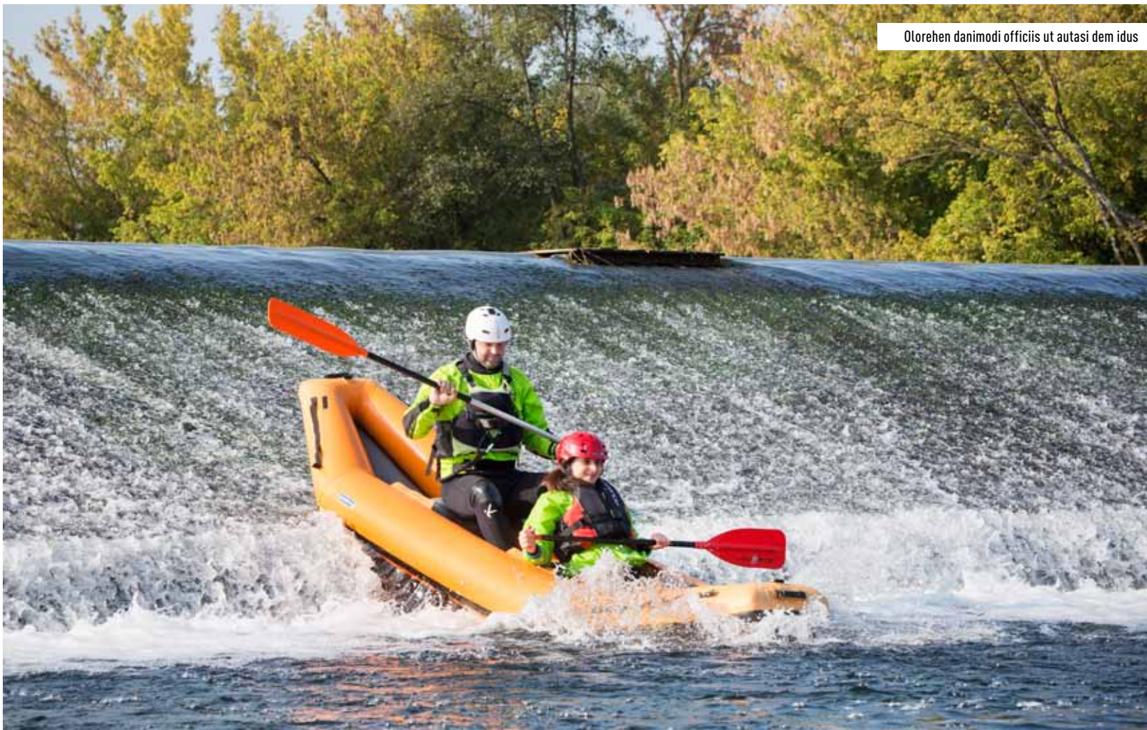
Olorehen danimodi officis ut autasi dem idus