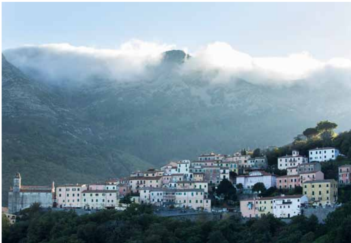
Marciana op de flank van de Monte Capanne.

Aan de horizon zien we de Corsicaanse bergketens.