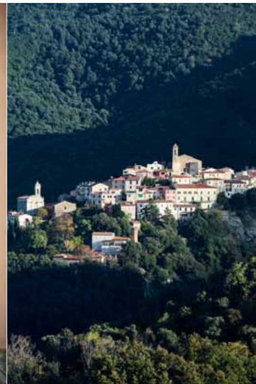
Napoleon is nog steeds overal aanwezig op het eiland.