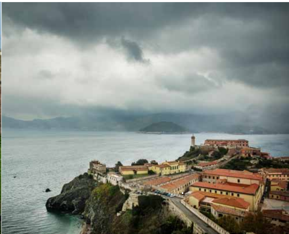
De haven van Portoferraio, de ingang naar Elba.

Zo'n tien wilde geiten balanceren op een steile rotswand. Hun lange sikken wapperen in de wind.