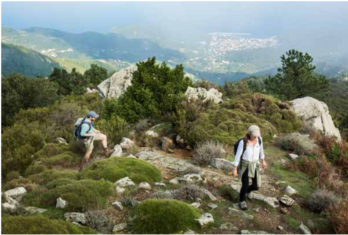
Vanaf de GTE zie je in alle windrichtingen de zee.