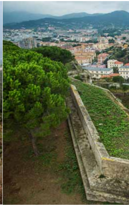
Het Fortezza Medicee hoog boven Portoferraio.