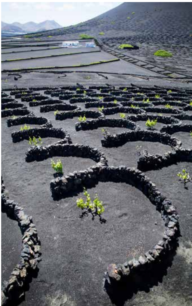
Elke wijnrank wordt beschermd door een hoefijzervormig stapelmuurtje.

Op sommige plekken zit de vruchtbare grond vier meter diep. Dan groeit de druivenrank vanuit de diepte naar het licht. Boven het gat is een houten frame geplaatst waarop de rank rust. 'Een oude stonk als deze is gemakkelijk honderd jaar oud en produceert zo'n 110 kg druiven.' Om de planten te beschermen tegen de wind zijn er hoefijzervormige muurtjes rond het gat gebouwd. Iedere druivenrank staat zo in zijn eigen hoyo . Of dat geen zeer arbeidsintensieve manier van werken is? 'Ja, dat klopt,' geeft de gids toe. 'De productie is erg laag. Gemiddeld rekenen we op één fles wijn per plant. Vanwege de waterschaarste kunnen we ook niet meer druivenranken planten.' Maar vulkanische wijn van Lanzarote moet je drinken als een fijnproever. De witte malvasiadruij heeft zich genetisch aangepast aan de vulkanische ondergrond. ■