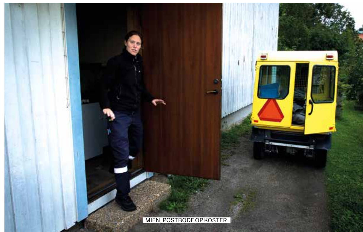
MIEN, POSTBODE OP KOSTER.