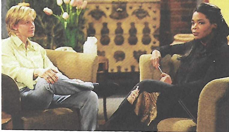
Ellen DeGeneres dans Ellen , "The Puppy Episode".

1993 : En adaptant Les Chroniques de San Francisco , la chaîne publique PBS atteint des records d'audience. Aucune série n'avait dépeint avec autant de réalisme la communauté gay de San Francisco. Mais le backlash est énorme. Pour conserver son financement public, la chaîne décide de ne pas participer à la production et à la diffusion de la saison suivante.