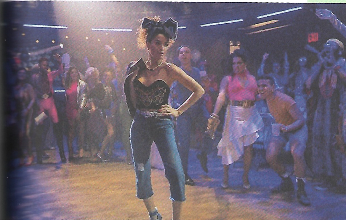
Evangelista (Indya Moore) dans Pose (2018).