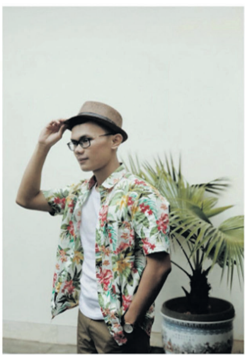
It's Time To Summer