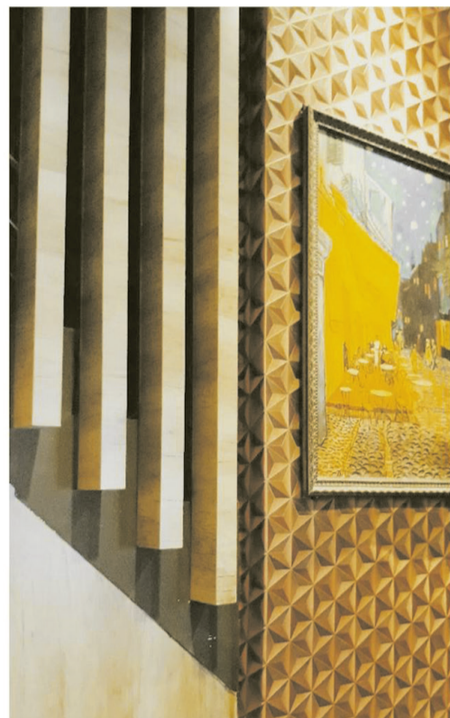
an architecture this photo was taken by me when i eaten in one of cafe in Siantar City, Medan !