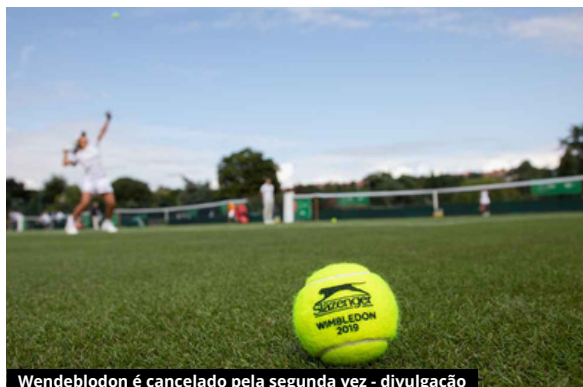
Wendebledon é cancelado pela segunda vez - divulgação

Contrary to popular belief, Lorem Ipsum is not simply random text. It has roots in a piece of classical Latin literature from 45 BC, making it over 2000 years old. Richarerature, discovered the undoubtable source. Lorem Ipsum comes from sections 1.10.32 and 1.10.33 of "de Finibus Bo(The Extremes of Evil) by Cicero, written in 45 BC. Tkk