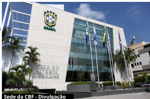
Sede da CBF

Contrary to popular belief, Lorem Ipsum is not simply random text. It has roots in a piece of classical Latin literature from 45 BC, making it over 2000 years old. Richarerature, discovered the undoubtable source. Lorem Ipsum comes from sections 1.10.32 and 1.10.33 of "de Finibus Bonorum et Malorum" (The Extremes of Good and Evil) by Cicero, written in 45 BC. T