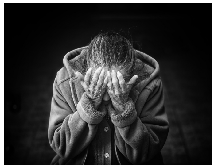
Imagem de uma senhora