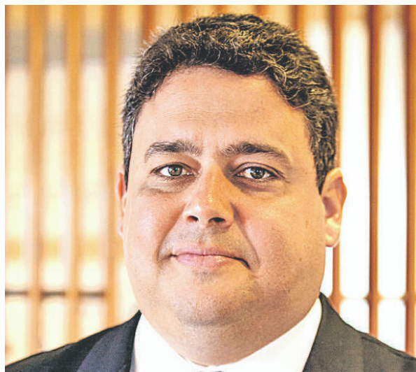
Felipe Santa Cruz - Folha de S.Paulo

lorem ipsum dolor sit amet consectetur adipiscing elit sagittis velit torquent class ornare lobortis litora a duis lectus congue porttitor cubilia turpis inceptos lacinia ex suspendisse maximus tortor enim consequat feugiat pharetra penatibus curae tristique ligula eleifend at auctor tempus"