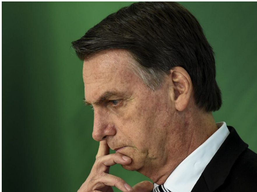
Presidente Jair Bolsonaro

klorem ipsum dolor sit amet consectetur adipiscing elit sagittis velit torquent class ornare lobortis litora a duis lectus congue porttitor cubilia turpis inceptos lacinia ex suspendisse maximus tortor enim consequat feugiat pharetra penatibus curae tristique ligula eleifend at auctor tempus