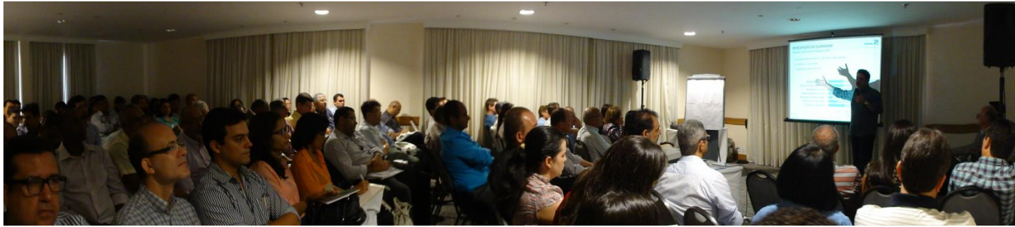
Salvador - BA

Algumas fotos de eventos da Escola de Iluminação em capitais do país