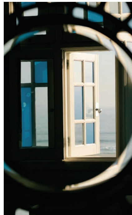
COURTESY OF THE ARTIST, GALLERIA CONTINUA AND BELMOND © MARCO VALMARANA, GABRIEL TESSEROLI

Voor de derde editie van de kunstreeks 'Mitico', een joint venture tussen Belmond en de internationale kunstgalerie Continua, kreeg Daniel Buren carte blanche. Zes legendarische luxeadresjes kregen nieuwe perspectieven, van het Copacabana Palace in Rio de Janeiro (hierboven) tot het Cipriani in Venetië (volgende pagina).