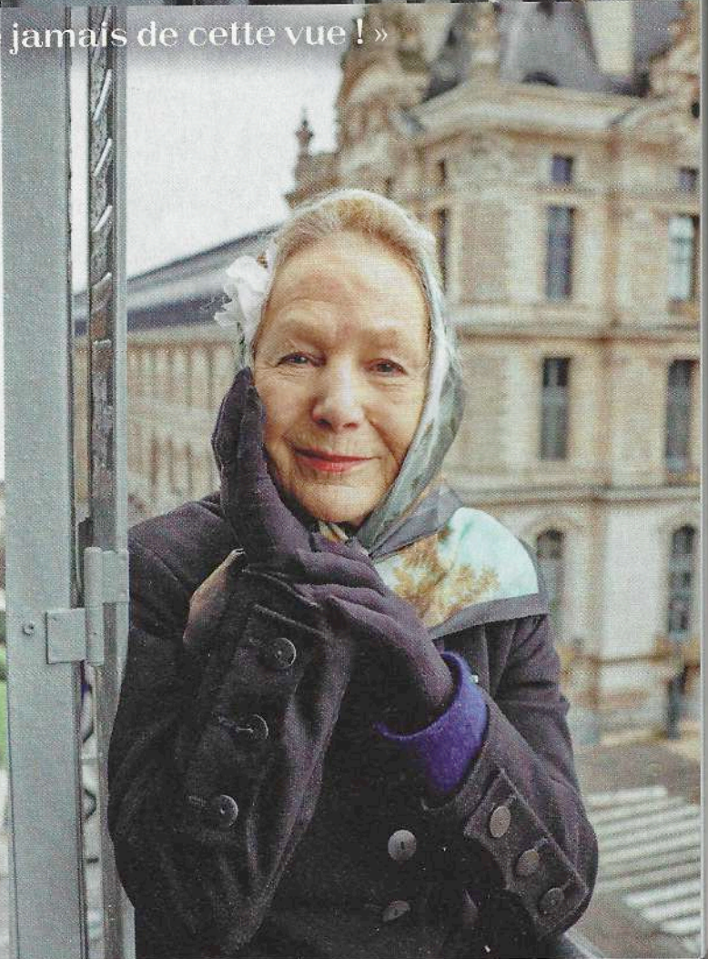
Agnès Troublé, aka agnès b. in her apartment overlooking the Louvre museum / Agnès Troublé, alias agnès b. dans son appartement avec vue sur le musée du Louvre