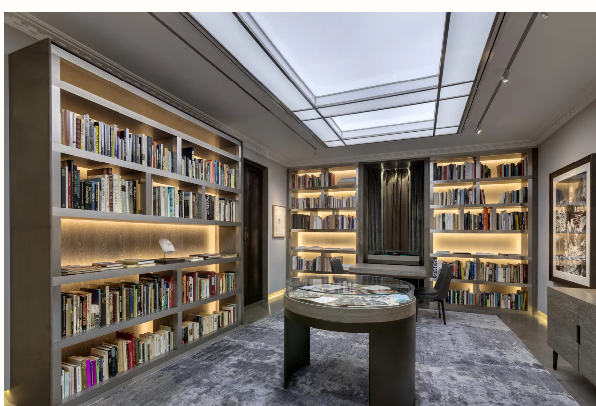
Bibliothèque de la Francis Bacon MB Art Foundation.