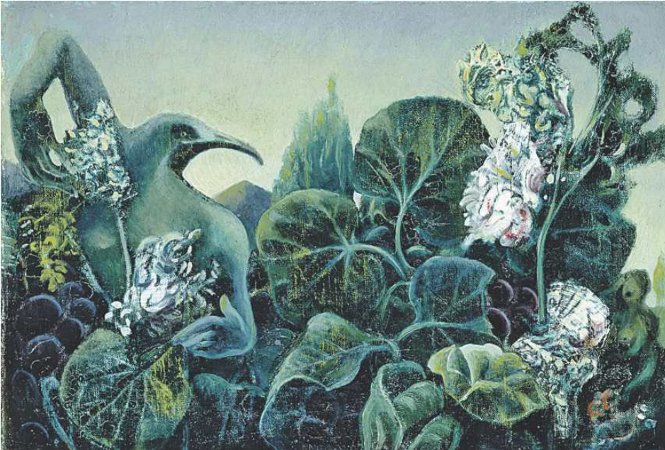
Nature dans la lumière de l'aube, 1936, de Max Ernst.