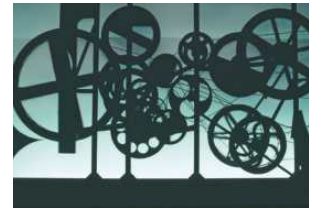
Vue de l'installation Requiem pour une feuille morte , 1967, de Jean Tinguely.

Siena, The Rise of Painting, 1300-1350, The MET, jusqu'au 26 janvier. metmuseum.org.