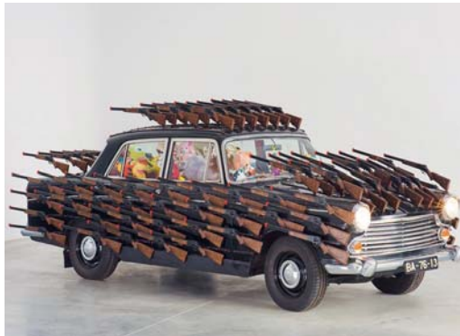
Joana Vasconcelos (à gauche) expose au MAAT (en haut) ses œuvres d'anthologie, dont War Games (en bas, 2011).