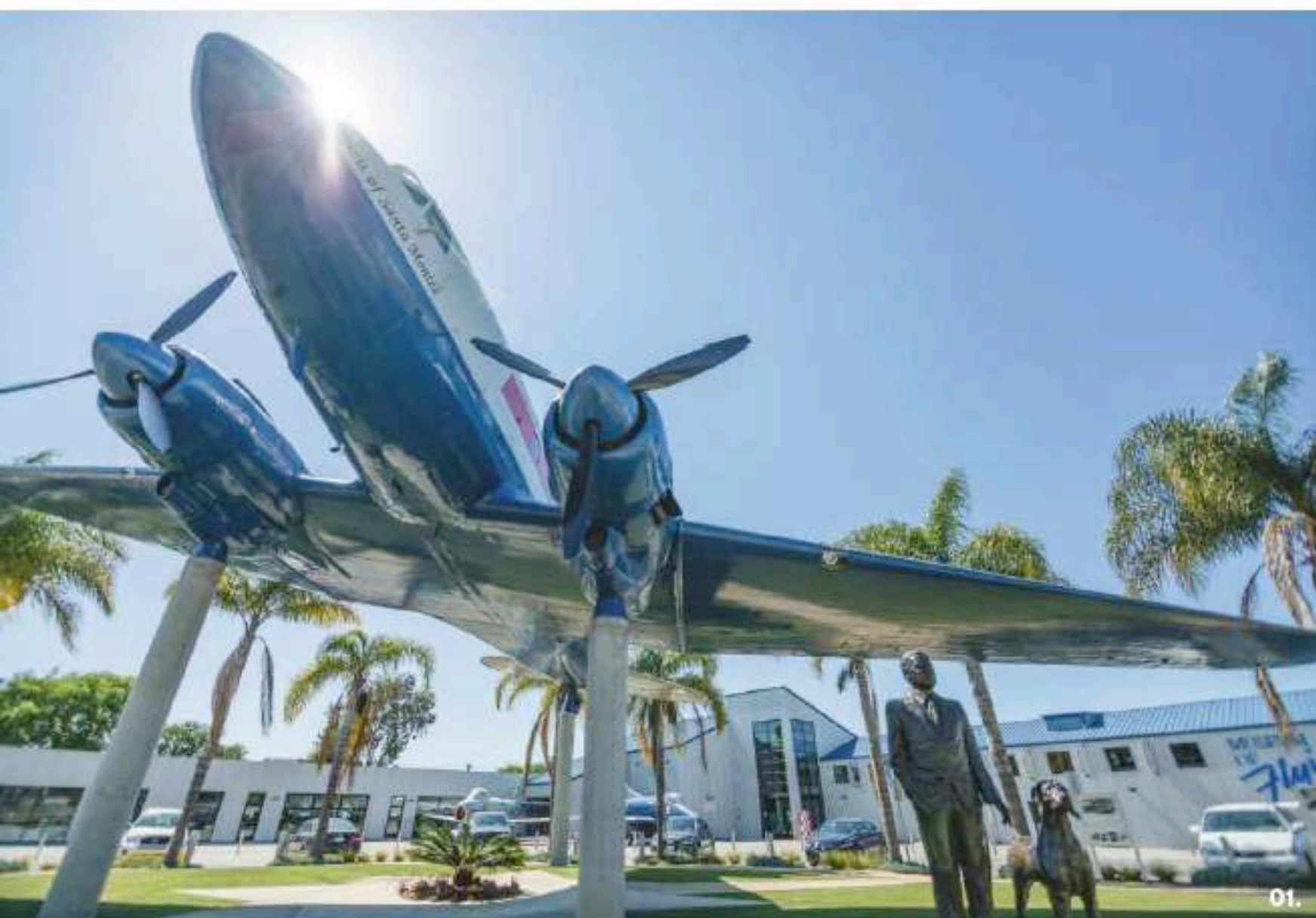
01. Le modèle Douglas DC-3, produit par la Douglas Aircraft Company entre 1936 et 1945, marque l'entrée du Museum of Flying. 02. L'immense plage qui borde Santa Monica s'étend de Venice Beach à Pacific Palisades. Page de droite Construite en 1949, la Eames House est un manifeste d'architecture abordable et fonctionnelle qui utilise des matériaux « prêts à l'emploi ».