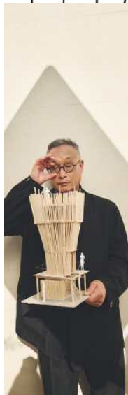
✓ Portrait de l'artiste Tadashi Kawamata.

et je laisse à d'autres le soin de rendre les choses possibles», s'amuse-t-il. De sa récente Avalanche de chaises dans la cour de Dover Street Market Paris à l'impressionnante chambre à coucher des entrepreneurs Catherine et Jean Madar, Kawamata s'inspire de la topographie des sites qu'il s'apprête à investir, croquant des esquisses au fil de ses visites, avant de construire des maquettes dans son atelier situé près de Paris. Pour les amateurs de grands millésimes, Kawamata a aussi imaginé un écrin en bois sculpté, disponible en édition limitée, pour abriter un jéroboam Ruinart blanc de blancs. G