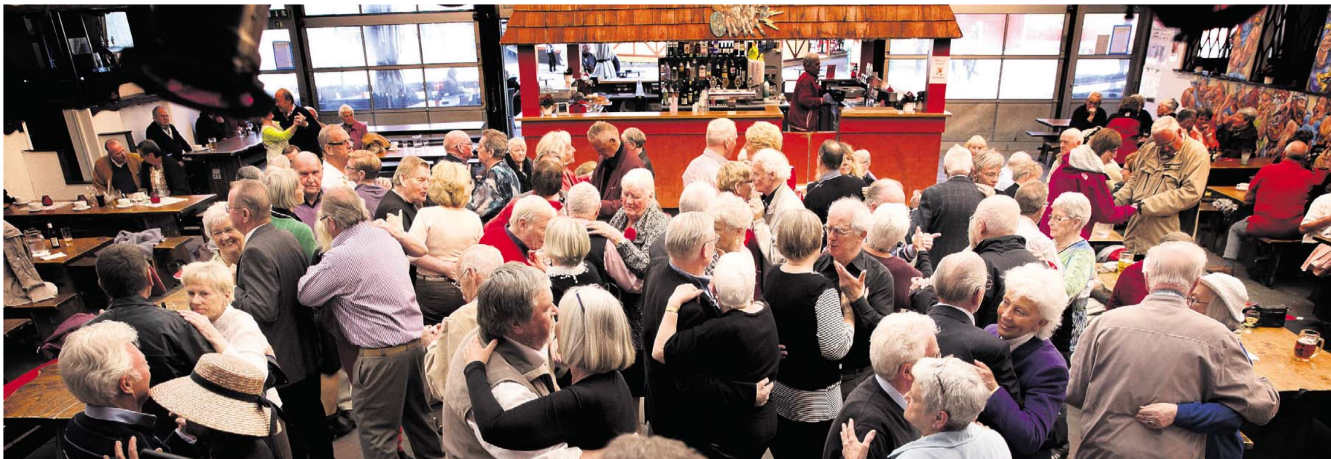
GRÅT GULD. Det lyder som en tilløkkende tanke at 'slippe pensionsformuen fri', fordi det er så gigantisk en pengekasse, der her og nu ville kunne løse mange af landets økonomiske problemer. Men det vil være en historisk fejltagelse.