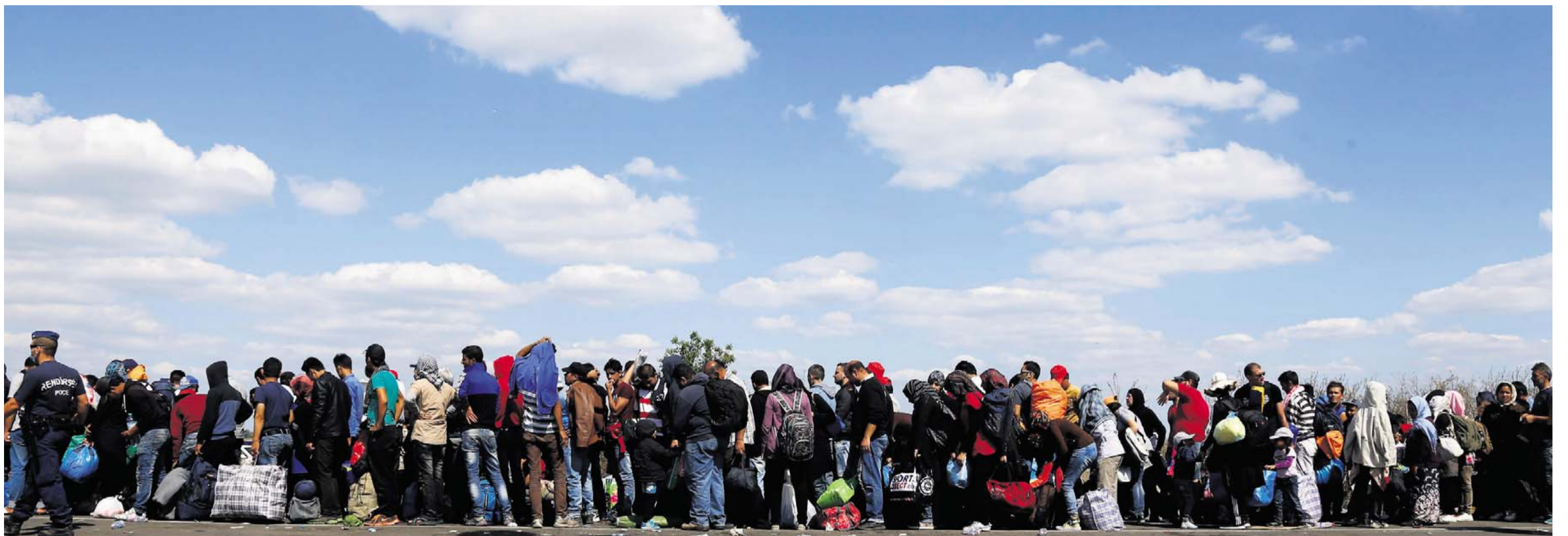
PÅ RAD OG RÆKKE. Flytningestrømmen skaber politiske spændinger. Men flygtninge og migranter er nødvendige, hvis EU skal opretholde befolkningstallet. Folk står i kø for at krydse grænsen mellem Serbien og Ungarn. Arkivfoto: AP/Matthias Schrader

Kilde: International Organization for Migration