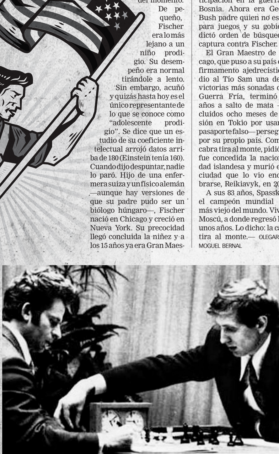
Imagen del duelo entre Spassky (izquierda) y Fischer, en julio-agosto de 1972, en Reikiavik