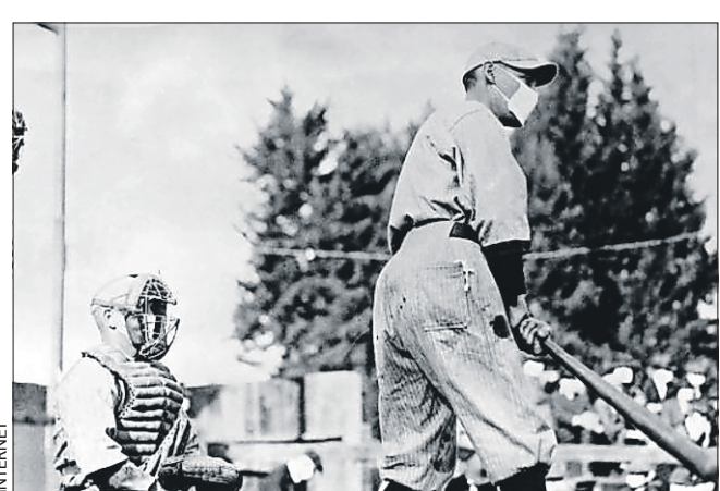
El cubreboca en el béisbol se usó por primera vez en California

Babe Ruth, también apodado “El Bambino”, estuvo a punto de morir en uno de sus contagios e incluso fue hospitalizado de urgencia, pero eso no le impidió ganar en siete ocasiones las Series Mundiales de ese deporte (1915, 1916, 1918, 1923, 1927, 1928 y 1932) con Boston y Yankees de Nueva York forjando así su immaculada leyenda.