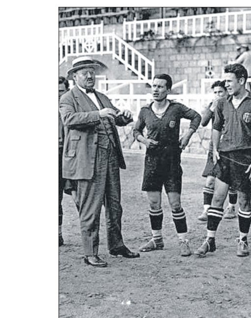
A la izquierda, Joan Gámper (izquierda) dialoga con algunos jugadores del Barcelona antes de jugar un partido en 1918. Debajo, parte importante de la escuadra del Real Madrid que compitió durante la temporada 2017-2018

Sí, esa fiebre, la que mató a más de 50 millones de personas en todo el mundo; la mallamada “gripe española”