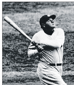
Arriba, Babe Ruth bateando. A la izquierda, final de la Stanley Cup de 2017 entre Seattle y Montreal, dos años antes de que los “Play offs” quedaran sin campeón

contagios de la “gripe española” para lograr aupar a los Medias Rojas de Boston como reyes de las Series Mundiales de béisbol, eso sí, durante una temporada que tuvo que reducirse por la escalada del virus.