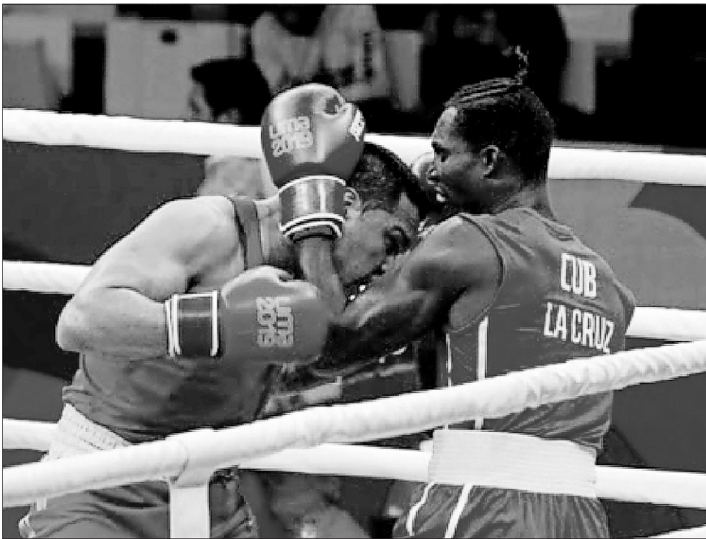
El equipo cubano de boxeo espera una reprogramación de eventos para prepararse con miras a Tokio

Hay cupos pendientes aún, que deberían quedar listos en marzo. Se unirán eventos de “fogueo” para retomar la condición y preparación.