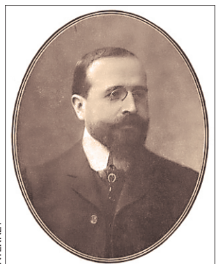
El poeta mexicano Francisco de Asís de Icaza y Beña nació el 2 de febrero de 1863 y falleció el 28 de mayo de 1925 a los 62 años