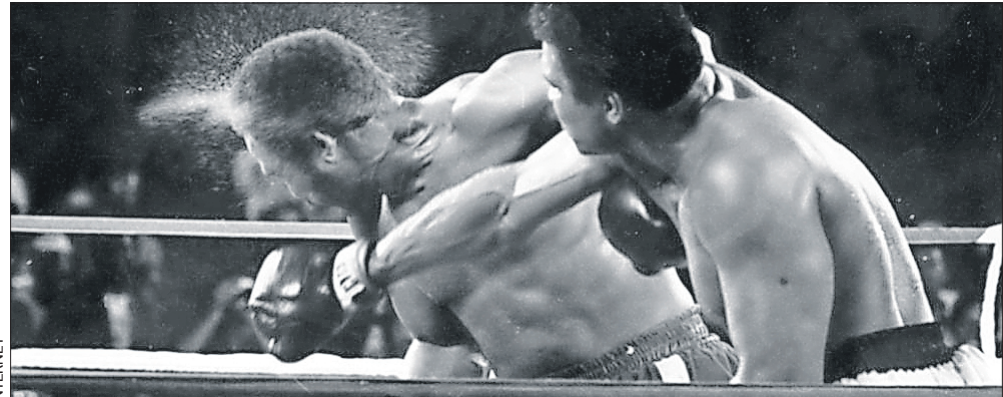
La pelea de Muhammad Ali y George Foreman ha sido una de las mejores de la historia de este deporte

De las 144 partidas que jugaron de 1985 a 1995, Kas-