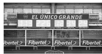
Reloj de Primera División