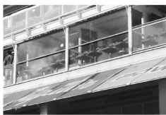
Palcos 32 palcos con mejor vista a la cancha. Tienen capacidad para 20 personas cada uno. Cuentan con televisor, bar y aire acondicionado.