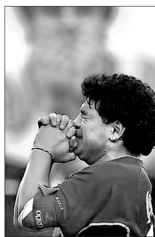
Arriba, Diego Armando Maradona el día de su homenaje con una playera de Boca en la que jugó los últimos minutos del partido. A la izquierda, imagen icónica de “La Bombonera” cuando juega Boca Juniors en ella

“Con todo el dolor del alma, ha llegado el momento de anunciar mi retiro. Se terminó el jugador de fútbol. Nadie está más triste que yo”, anunció el “Barrilete cósmico” horas después del par-