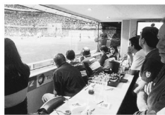
Palcos VIP 8 palcos con vista a nivel del cancha con capacidad para 14 personas cada uno. Cuentan con televisor, refrigerador, baño, bar, aire acondicionado y cristal de seguridad.