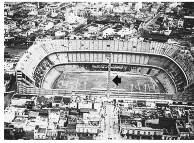
Estadio en sus primeros años. En el centro se puede apreciar la torre de los antiguos palcos.