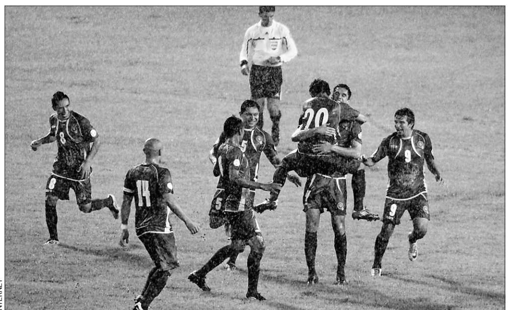
Imagen de la selección de las Islas Caimán celebrando un gol. Para las islas este evento es de relumbrón

El siguiente campeonato mundial de las islas se ce-