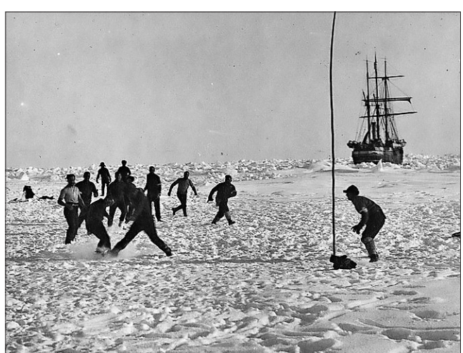
El primer partido de fútbol en la Antártida celebra su cumpleaños

Durante la presentación del torneo, bajo el lema “Orar y Jugar”, días antes de las medidas impuestas por Italia, ya se anticipaba la posibilidad de frenarlo.