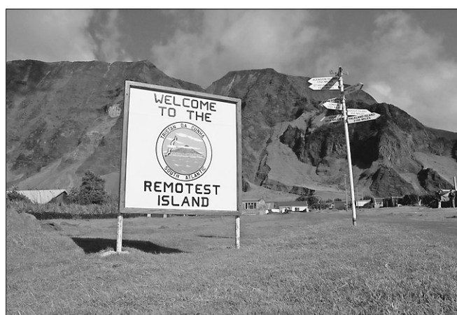
Tristán de Acuña es considerada la isla más remota del planeta

dad, Edimburgo de los siete mares, es la única habitada), el equipo solamente se puede enfrentar a los marineros que llegan en los barcos que atracan de vez en cuando en la isla, claro, si ellos son suficientes y quieren.