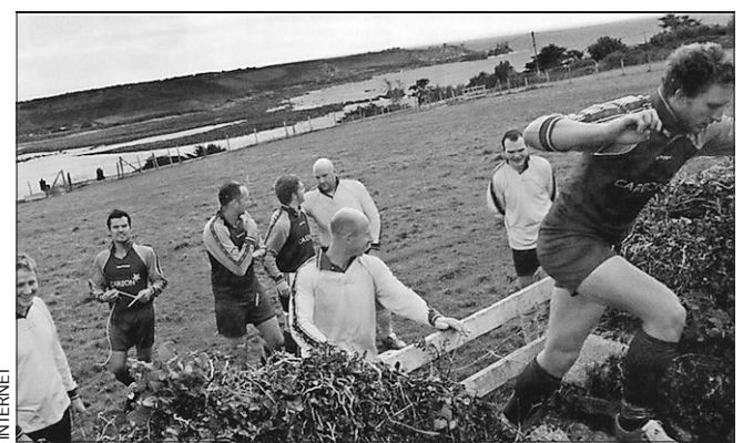
El fútbol en las Islas Sorlingas se vive con la pasión del fútbol británico, pero con dos equipos solamente que luchan por no ser segundos