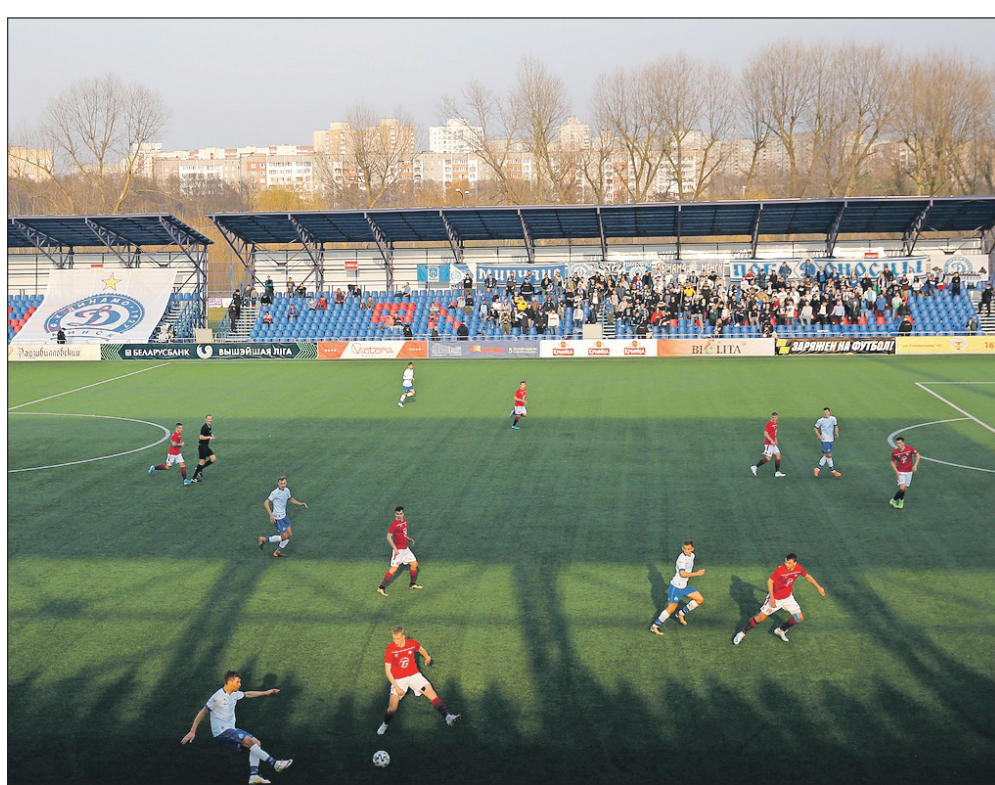
Imagen correspondiente al partido entre el FC Minsk y el Dinamo de Minsk celebrado en Bielorrusia

En contra está el presidente de la Federación de Fútbol Bielorrusa, Serguéi Zhardetski, quien no da su