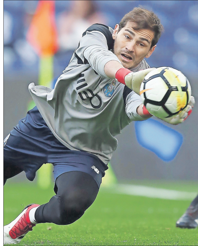
El portero Iker Casillas ataja el balón con el Oporto, su actual equipo

La UEFA desea concluir los torneos basándose en tres escenarios: reanudar las competiciones nacionales el 29 de mayo para finalizarlas el 30 de junio. En julio se disputarían la Liga de Campeones y la Liga Europa. Para ello, las federaciones han renunciado a las fechas de partidos de selecciones que estaban previstos.