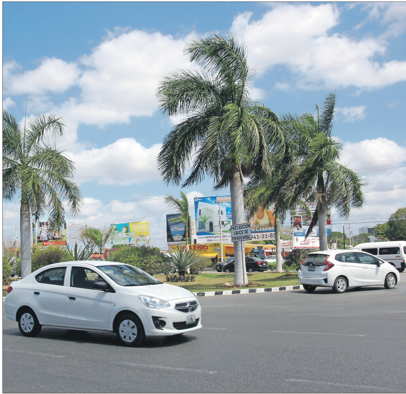
Aspecto de la glorieta ubicada frente al Centro de Convenciones Siglo XXI. Proponen el rescate de esas estructuras como soluciones viales

al final de la administración municipal de César Bojórquez Zapata, cuando se estaba discutiendo una “iniciativa absurda” de hacer infraestructura vial basada en segundos pisos, túneles y otros trabajos de ese tipo, un grupo de arquitectos decidió trabajar de manera voluntaria en un proyecto sobre los puntos conflictivos de la vialidad de Mérida y al final presentó propuestas de solución, que en términos generales consistían en un nuevo trazo geométrico. Ninguno