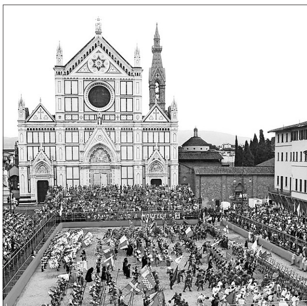
Arriba, imagen de la Plaza Santa Croce durante el festejo en el que tiene lugar la competencia. A la izquierda, un aspecto del juego

cinco mediocampistas y 15 delanteros) cada uno se enfrentan entre sí durante 50 minutos. Hasta ahí todo bien. El problema llega cuando la regla fundamental del juego es que vale todo, desde puñetazos, patadas y cabezazos, hasta estrangulamientos. Tal cual. Eso sí, con ciertos límites: no golpear a un oponente desde atrás; no hacerlo cuando está en el piso, o