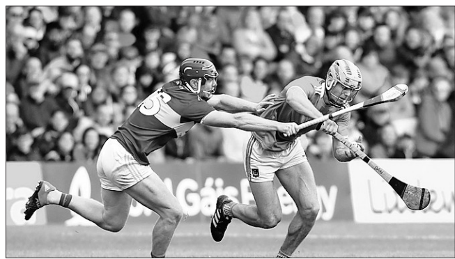
El hurling mueve masas en Irlanda desde tiempos casi inmemoriales

Con una tradición más longeva que el fútbol gaélico, el hurling mueve masas y su nacimiento oficial como deporte reglamentado tuvo lugar en 1884.