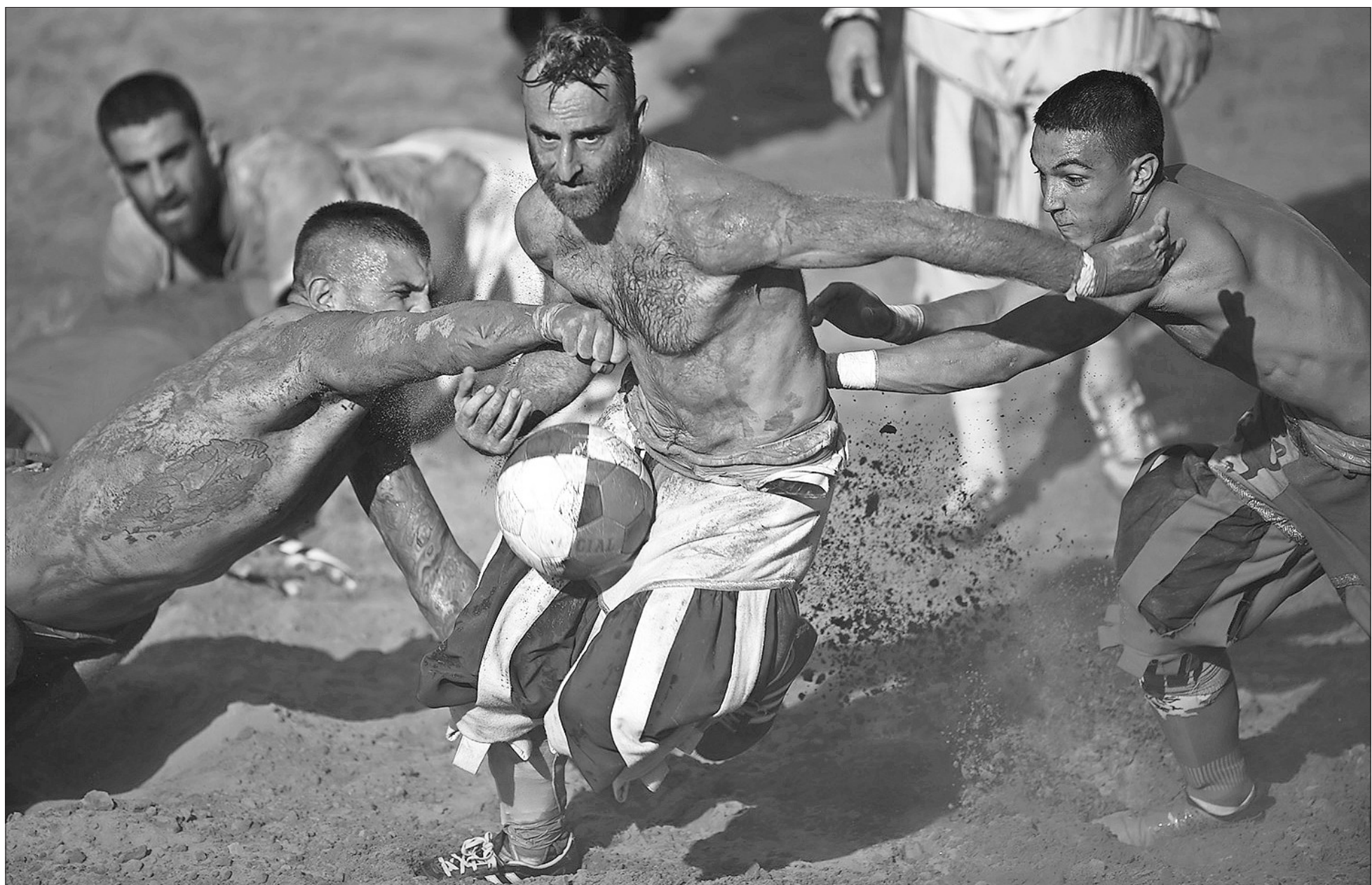
Las reglas un tanto laxas del "calcio storico fiorentino" hacen que se llene la cancha acondicionada para recibir la competición una vez al año. Puñetazos, patadas e incluso estrangulamientos son legales