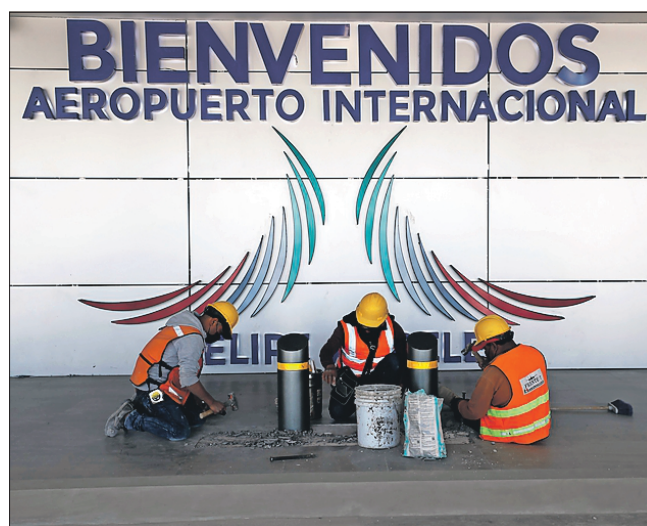
Militares ultimán detalles del Aeropuerto Internacional Felipe Ángeles, el nuevo de Ciudad de México, una de las obras insignia del gobierno federal que lleva un avance del 87% y debe inaugurarse en marzo