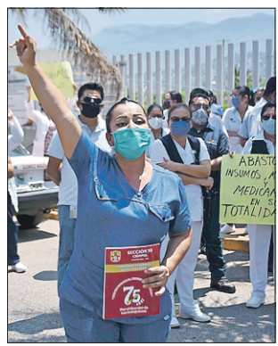
Médicos se manifiestan en Tuxtla Gutiérrez, Chiapas, por la falta de medicinas anti-Covid

En su texto, el médico expone que el desmantelamiento del sistema de compras, la erradicación del Seguro Popular y el mal manejo de la