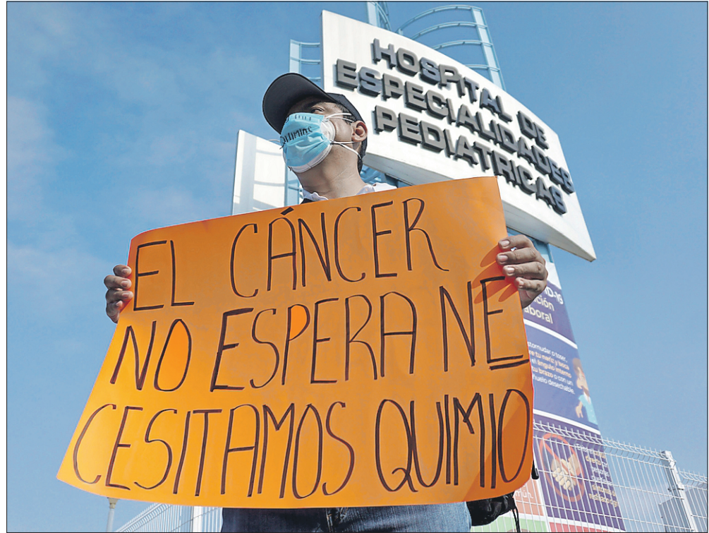
Padres de familia de niños con cáncer en una marcha en Tuxtla Gutiérrez para denunciar el desabasto de medicamentos oncológicos. Un libro da voz y rostro a todos los afectados por este problema en el país

En el texto, el médico cirujano recoge historias de