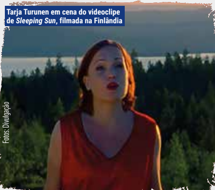
Tarja Turunen em cena do videoclipe de Sleeping Sun , filmada na Finlândia

No trajeto do Nightwish, após a lua de mel musical de Angels Fall First , surgiram algumas tensões que, embora não tenham levado à ruptura imediata, serviram como um sinal de alerta, instigando todos a refletirem sobre seus próprios comportamentos. O cerne desses desentendimentos residia na dinâmica de composição, centralizada em Tuomas. O tecladista, por esse motivo, acabava abocanhando mais ganhos financeiros do que seus colegas de banda. O destaque e foco em Tuomas eram naturais,