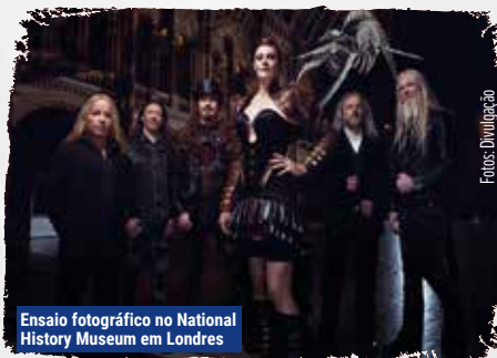
Ensaio fotográfico no National History Museum em Londres

O turbilhão de acontecimentos no Nightwish parece ter atingido o ápice e com Floor anunciando que está grávida novamente, o mais sábio a fazer era dar uma pausa. Ainda que o motivo oficial do intervalo não tenha sido cravado, quem