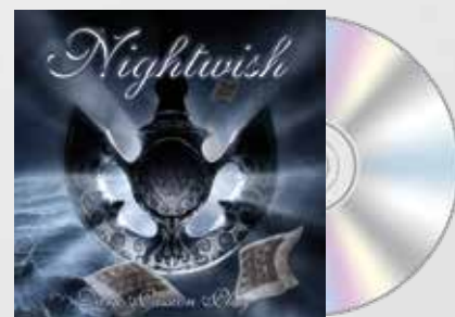
Dark Passion Play (2007)