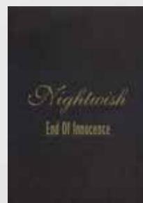
End of Innocence (2003)