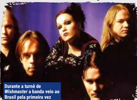
Durante a turnê de Wishmaster a banda veio ao Brasil pela primeira vez

Tarja Turunen, que apresenta alguns de seus trabalhos mais aclamados em Wishmaster , lembra que foi neste álbum que descobriu como explorar todo o potencial de sua voz. "Percebi que nossa música era formada por vários elementos. Isso me espanta até