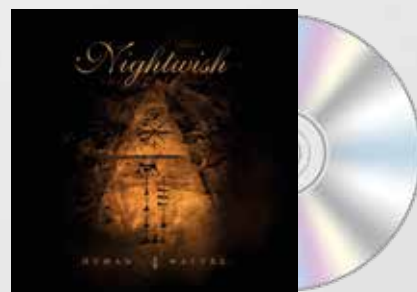
Human. :II: Nature (2020)