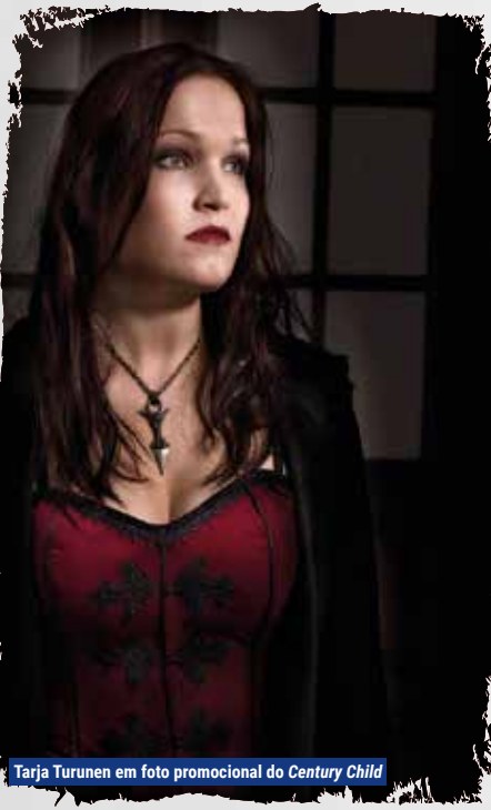
Tarja Turunen em foto promocional do Century Child

Century Child marca o quarto álbum de estúdio do Nightwish, lançado em 24 de maio de 2002 pela Spinefarm Records. O sucesso do álbum foi imediato. No dia do lançamento, conquistou Disco de Ouro na Finlândia e, posteriormente em 2003, alcançou Disco de Platina Dupla. Em 2002, foi o segundo disco mais vendido na Finlândia, totalizando 60 mil cópias comercializadas. E esses números continuam impressionantes: atualmente, Century Child ultrapassa as 90 mil cópias vendidas apenas na Finlândia. Globalmente, entre 2002 e 2003, o álbum atingiu a marca de mais de 350 mil cópias vendidas. Esse sucesso expressivo solidificou ainda mais o Nightwish como um dos