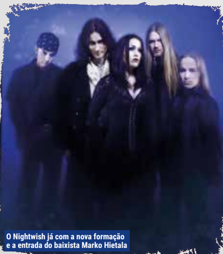
O Nightwish já com a nova formação e a entrada do baixista Marko Hietala