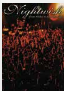
From Wishes to Eternity (2001)