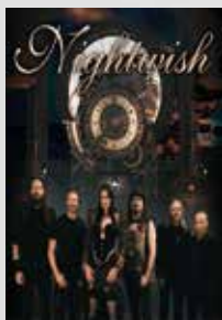
Virtual Live Show from the Islanders Arms 2021 (2022)