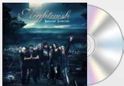
Showtime, Storytime (2013)