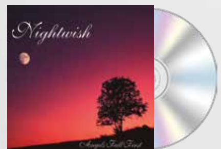
Angels Fall First (1997)