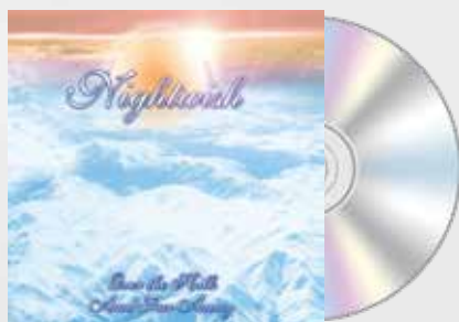
Over the Hills and Far Away (2001)