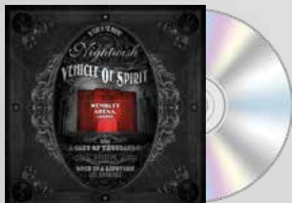
Vehicle of Spirit (2016)

A pandemia não dava trégua e a turnê de divulgação de Human :: Nature precisou ser adiada várias vezes. O maior problema interno, entretanto, surgiu quando Marko Hietala anunciou em 2021 que deixaria a banda alegando problemas de saúde mental e discordância de práticas da indústria fonográfica. “Estou deixando o Nightwish e minha vida pública. Há alguns anos não tenho sido