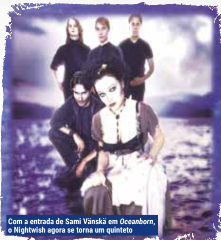
Com a entrada de Sami Vänskä em Oceanborn , o Nightwish agora se torna um quinteto

Com uma instrumentação mais refinada, possibilitada pelo aprimoramento do equipamento, o resultado foi um som mais polido e cativante. A engenharia sonora no estúdio contou com a habilidade de Mikko Karmila na mixagem e Mika Jussila na masterização complementando o time de peso.