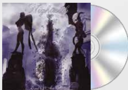
End of an Era (2006)