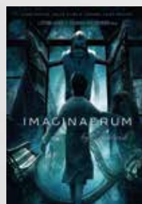
Imaginaerum (Filme - 2011)