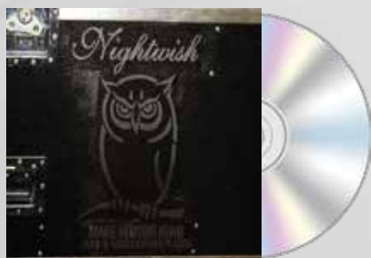
Made in Hong Kong (2009)

Belo Horizonte, Brasília, Manaus, Fortaleza, Recife, Vila Velha e Rio e Janeiro. Como não poderia deixar de ser, Anette cantou hits da era Tarja durante os shows. Canções como The Siren , Ever Dream e Dead to the World ganharam formato inédito com a ausência dos vocais líricos. Os fãs, novamente, se dividiram. Em entrevista para a Metal Blast, Olzon refletiu sobre a