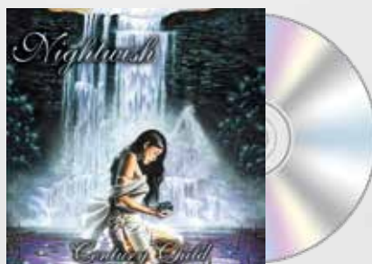
Century Child (2002)