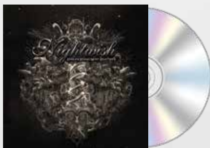
Endless Forms Most Beautiful (2015)