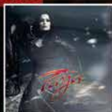
TARJA DARK CHRISTMAS