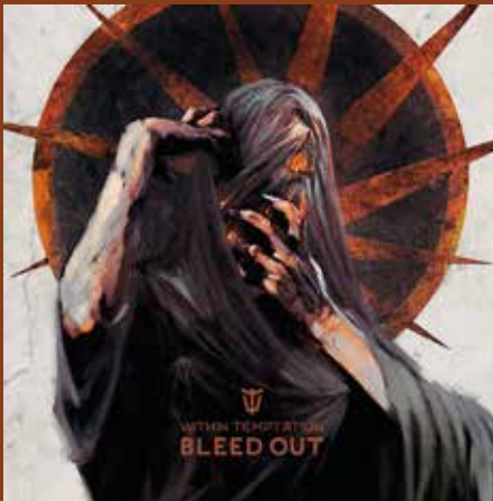
BLEED OUT XXXXXXXXXXXXXXXXXXXXXXXXXX - Imp.

Sharon: Para ser honesta, eu não ouço metal sinfônico. Gosto da melancolia e isso é o principal, sabe? Nós gostamos dos elementos sinfônicos, mas nunca ouvimos muito esse tipo de som, na verdade. Agora, quando você acrescenta esse ingrediente orquestral, isso eleva as músicas para um nível diferente. Lembro que o Metallica fez isso no passado e foi tipo: 'Meu Deus!' Nós sempre tivemos elementos de música sinfônica e foi muito legal quando começamos a fazer isso com uma orquestra de verdade. Lá atrás, fizemos Mother Earth (2000), que não foi com uma orquestra real, eram sons simulados no teclado. Depois, com The Silent Force (2004) e The Heart of Everything (2007), tivemos muita sorte de ter uma gravadora que quis embarcar em projetos