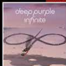
DEEP PURPLE INFINITE - THE GOLD EDITION