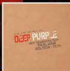
DEEP PURPLE LIVE IN TOKYO