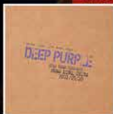
DEEP PURPLE LIVE IN HONG KONG