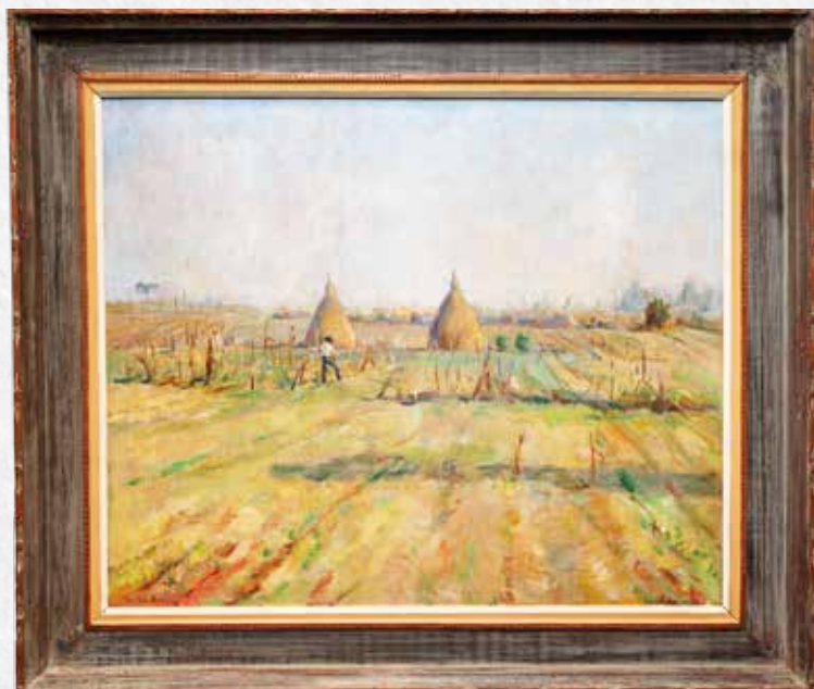
Campo de Cultura , 1960. Óleo sobre tela, 75 cm x 90 cm