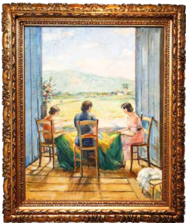
Cosendo a Bandeira , 1939. Óleo sobre tela, 98 cm x 78,5 cm