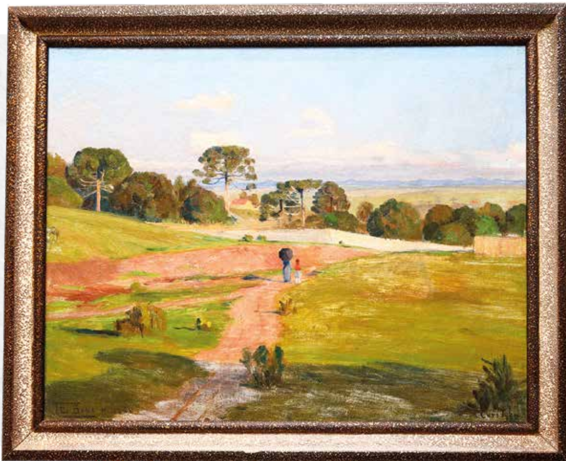
Paisagem de Curitiba , 1925. Óleo sobre tela, 47 cm x 61 cm