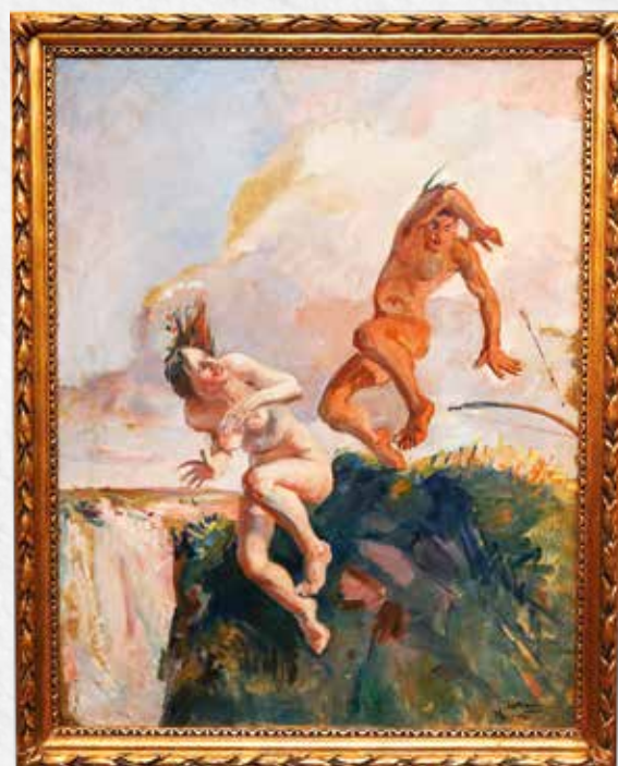
Lenda de Yara , 1935. Óleo sobre tela, 90 cm x 69 cm