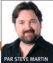
PAR STEVE MARTIN