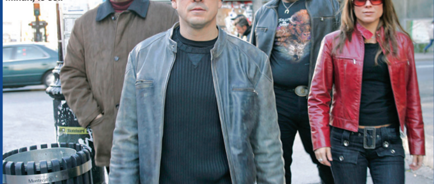
Julien Poulin, Claude Legault, Louis Champagne et Julie Perreault, Minuit, le soir

“ CERTAINES SÉRIES QUÉBÉCOISES SONT VRAIMENT DANS UNE CLASSE À PART. NOTRE TÉLÉ TÉMOIGNE DE NOTRE ENVIE D'EXISTER, DE NOUS DÉMARQUER. ”