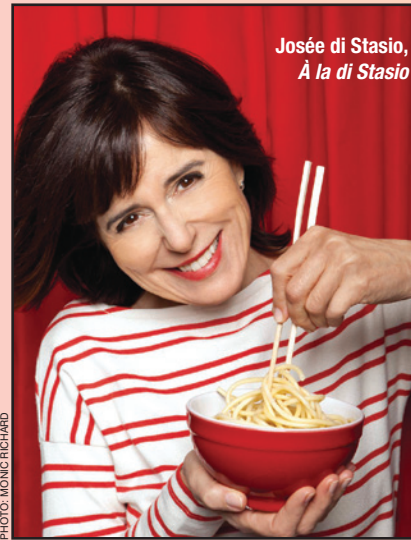
Josée di Stasio, À la di Stasio