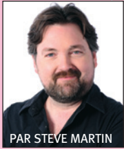
PAR STEVE MARTIN