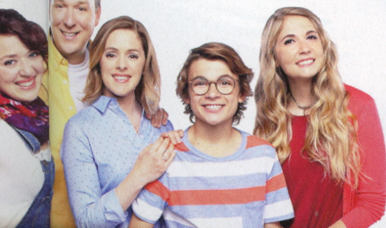
Entourée de son petit clan télévisuel dans Conseils de famille .

«Je suis gourmande de tout, mais particulièrement des fruits de mer comme le homard et le crabe. J'aime aussi le foie gras. Ceci dit, on peut me recevoir avec de la soupe, et je serai totalement heureuse. Mais si on veut