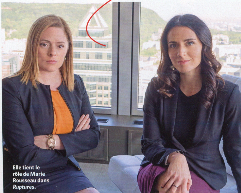
Elle tient le rôle de Marie Rousseau dans Ruptures .

«Si je suis nulle dans un domaine, ce sont les maths! Ça et la science, de façon générale. Mon fils est en quatrième année et il a commencé à faire des divisions avec des restes, alors que moi, je ne me souviens plus comment faire... Dans la vie, je voulais être dentiste, comme mon père. Puis, quand j'ai commencé à faire des maths et des sciences de façon plus sérieuse à l'école, j'ai rapidement compris que ça serait trop difficile pour moi et que j'haïssais ça! Disons que je n'ai pas hérité de ce gène, alors que mes frères ont tous les deux des cerveaux de mathématiciens. Quand je dois jouer avec les chiffres, j'ai mal à la tête après deux minutes. Je déteste ça!»