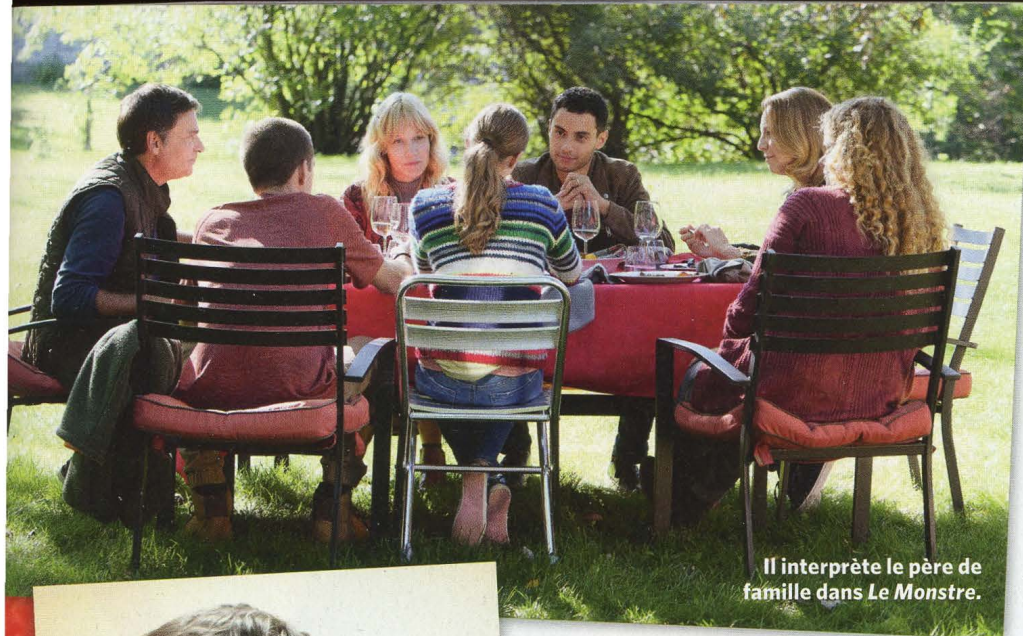
Il interprète le père de famille dans Le Monstre .