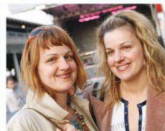
«Ma soeur jumelle est beaucoup moins timide que moi. Je fais un métier public, mais je suis beaucoup plus réservée et plus pudique qu'elle.»

et on le joue toujours aujourd'hui, parce que ses pièces ont la même portée et qu'elles restent, aussi, accessibles à tout le monde. C'était vraiment un génie de la nature humaine.