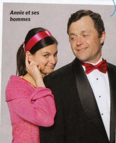
Annie et ses hommes