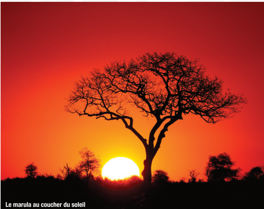
Le marula au coucher du soleil